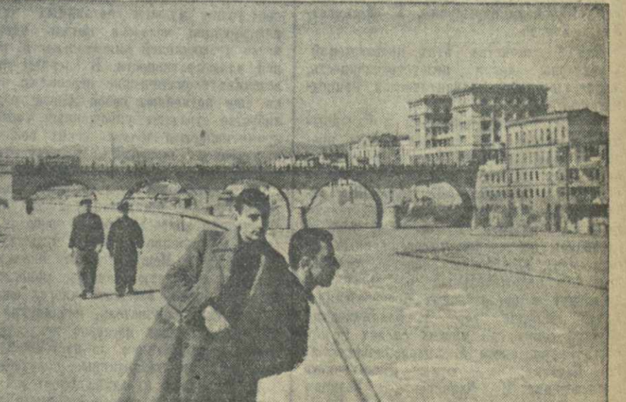
На набережной имени СТАЛИНА у моста Карла Маркса.

ТБИСУЛИ. (Наш корр.). Недавно в Гелати, в районе новых угольных копей, открылось агентство связи. Агентство расположилось в помещении управления копей. Пока оно производит почтовые и телефонные операции. В скором времени здесь будет установлен телеграфный аппарат.