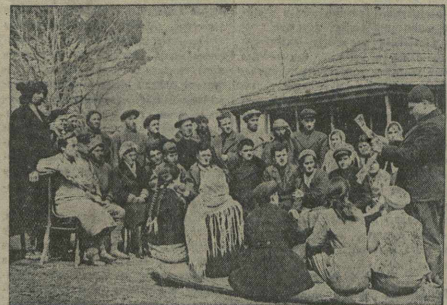
Председатель колхоза сел. Чавинидзе колхозникам постановление СНК СССР и ЦК ВКП(б) от 13 марта 1941 года о доплате за выработку сверх нормы на плантациях.

В прениях по отчетному докладу выступили тт. Чарав (супутная фабрика), Саркисов (зав. им. Калинина), Мурашвили (исполком райсовета), Мешвельца (завод им. Куйбышева), Боджуа (Грузинский индустриальный институт имени Кирова), Лабаша (райком партии), Ладжава (прокурор района), Дарчиани (кинокопировальная фабрика), Абашидзе (6-а школа).