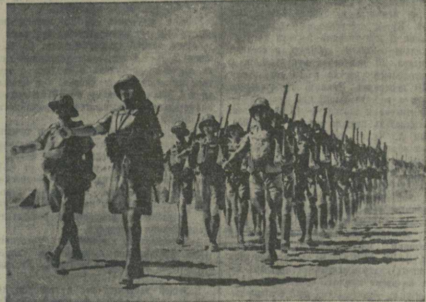
Английские войска на фронте в Западной пустыне.

В Восточной Африке, в Эритрее продолжается сражение в районе Керена. В секторе Джи-Джиги (к востоку от Харара) противник оказывает сильный нажим, но сдерживается нашими войсками. Пункт Негелли (на юге Абиссинии), эвакуированный нашими войсками, занят противником. В секторе Яеяло (на юге Абиссинии) отбита неприятельская атака. Английские самолеты совершили налет на Асмару (Эритрея): убито 9 и ранено 23 человека, повреждены жилые дома.