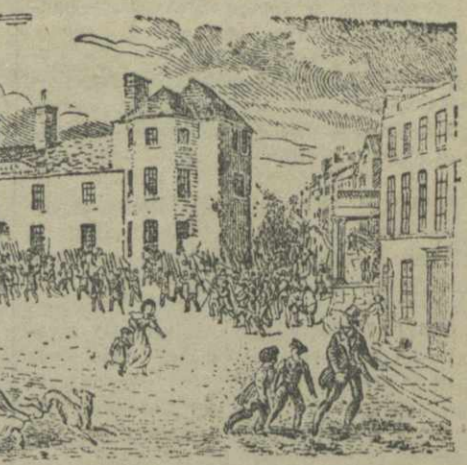
Вооруженное выступление чартистов у отеля Вестгаг.

Тория — название буржуазной политической партии в Англии XVII—XIX вв. Возникла одновременно с соперничеством с новой партией вигов. Опора тория — крупные землевладельцы. Тория черпала власть и влияние. В начале 40-х годов XIX в. стала называться консерваторами.