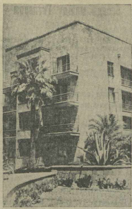
Дом отдыха «Сино» в Сухуми.