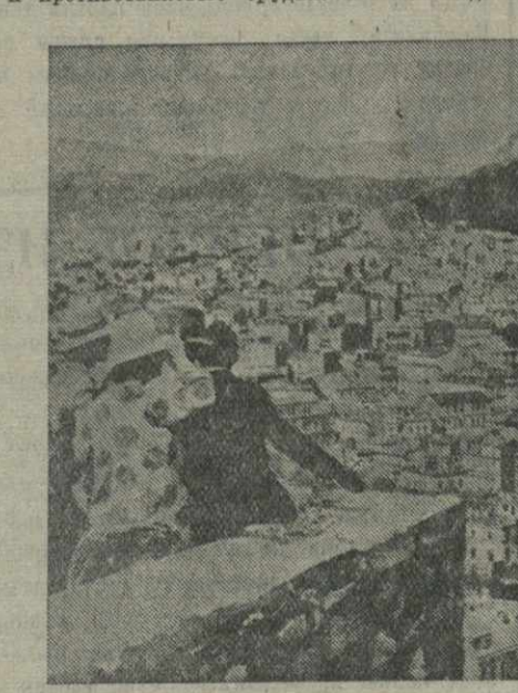
Вид на столицу Греции — Афины.

ЛОНДОН, 23. (ТАСС). Как передает агентство Рейтер, газета «Дэйли телеграф энд Морнинг пост» опубликовала сообщение о реорганизации бронетанковых частей английской армии. На вооружении новых самостоятельных мотомеханизированных соединений будут состоять танки новейшего образца, артиллерия, зенитные и противотанковые орудия. В эти соединения будут включены части военно-инженерных войск и моторизованные пехотные части. Главным типом танка для этих соединений будет танк-крейсер, обладающий большой скоростью и большой огневой мощью. В конструкции танков внесены изменения с целью усиления наступательной мощи английской армии.