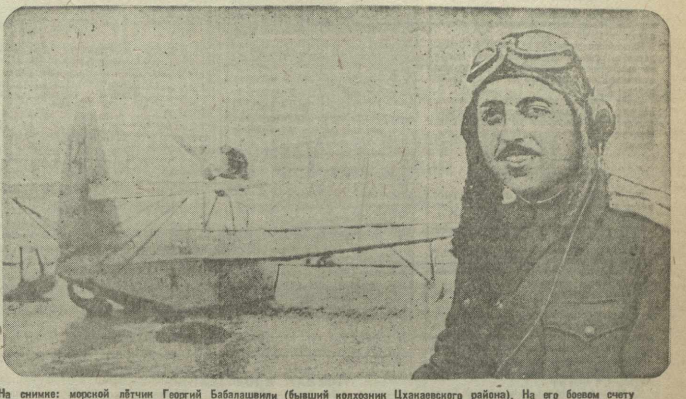
На снимке: морской лётчик Георгий Бабалашвили (бывший колхозник Цханавского района). На его боевом счету 3 уничтоженных вражеских артиллерийских батарей, 6 прожекторных установок и 2 баржи. Награжден орденом Красного Знамени.