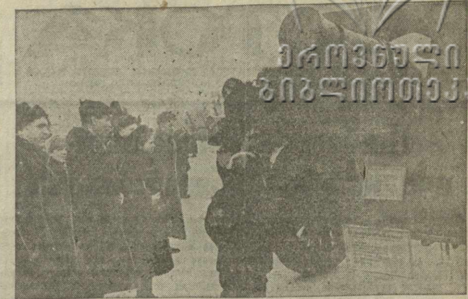
На выставке образцов трофейного вооружения, захваченного у немцев (Москва). На снимке посетители осматривают новые виды орудий, достраиваемых Ленинградом и захваченные войсками Ленинградского фронта.

На узком участке фронта из района Войсба с целью прорыва на запад двинулись на наши позиции крупные силы пехоты и до 100 танков. Этот мощный кулак пехоты и танков должен был, как казалось немцам, протаранить одним ударом кольцо окружения. На контратакующих гитлеровцев обрушилась лавина огня. Немцы несли колоссальные потери. Вражеская вылазка закончилась полным крахом. На поле боя, по далеко не полным данным, немцы оставили более 3.000 убитых солдат и офицеров и не менее 30 подбитых и сожженных танков.