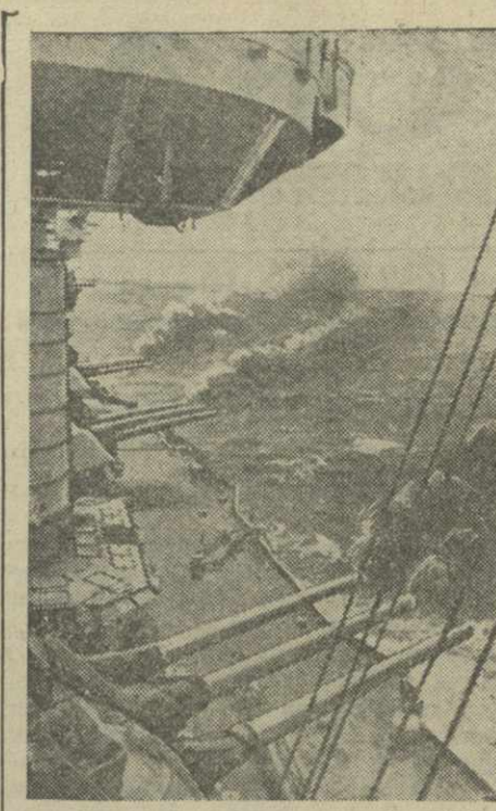
Действующий Черноморский флот. На снимке: линкор «Париска коммуна» ведет огонь орудиями главного калибра по румыно-немецким войскам.

В одном из писем молодого иранского иранец говорит: «Бойцы-герои Красной Армии! Приветствую при сем свои