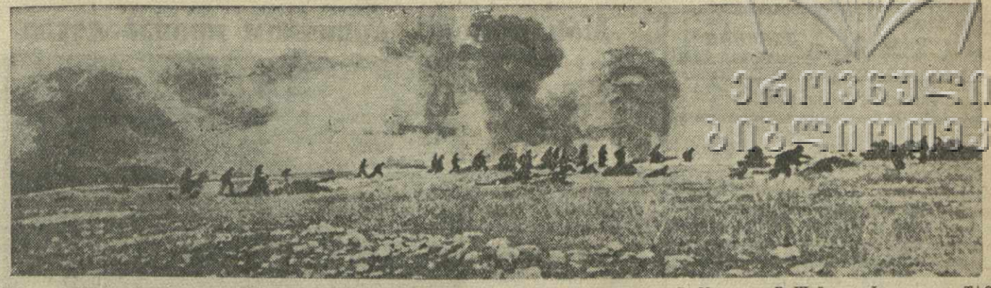
Героическая защита Севастополя. На снимке: морская пехота в наступлении.

Обращение рабочих, инженерно-технических работников и служащих Кузнецкого металлургического комбината имени Сталина ко всем металлургам Советского Союза