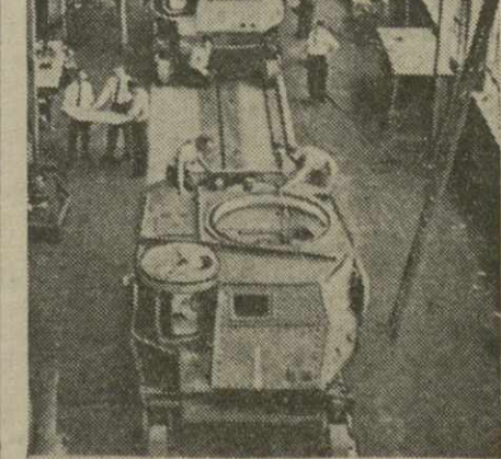
Производство танков на одном из заводов в США.

Криспс далее сказал: «Теперь мы располагаем полной поддержкой Соединенных Штатов Америки в войне. Их помощь с каждым днем возрастает и становится все более эффективной. Учитывая промышленную мощь, стоящую за ними, в сочетании с нашими собственными производственными ресурсами и ресурсами Советского Союза, ясно, что в конечном счете будет создана непреодолимая сила. Наступит момент, когда мы сможем сказать: «Мы победили»».