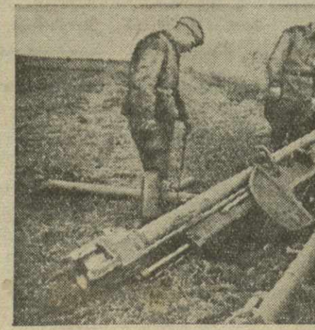
Здесь прошли советские танки (Юго-Западный фронт). На снимке: германские орудия (слева) и фашистский танк (справа), раздавленные мощными советскими танками.