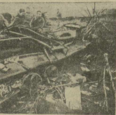
Здесь прошли советские танки (Юго-Западный фронт). На снимке: германские орудия (слева) и фашистский танк (справа), раздавленные мощными советскими танками.