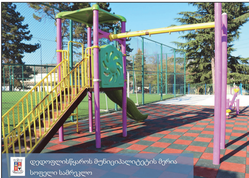
დედოფლისწყაროს მუნიციპალიტეტის მერია სოფელი სამრეკლო

შეგახსენებთ, რომ „სოფლის მხარდაჭერის“ პროგრამის ფარგლებში სოფლის(ეზოს) მოსახლეობა კრებაზე თანხმდება სოფლის საჭიროებაზე და ამ პროგრამის დახმარებით სდება საშუაოების შესყიდვა. „სოფლის მხარდაჭერის“ პროგრამით ყველაზე ხშირად ფინანსდება შიდა სასოფლო გზები, შიდა განათება, შიდალოცვა, წყაროების მოპირკეთება, სკვერების მოწყობა, მინი სპორტული ინფრასტრუქტურის მოწყობა და ა.შ.