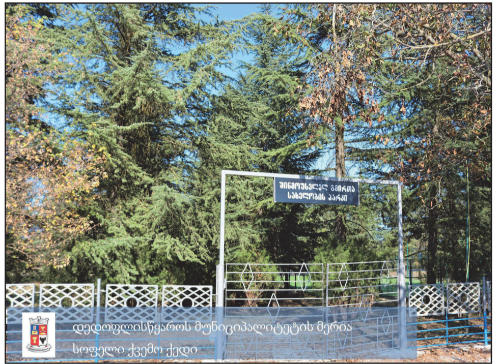
დედოფლისწყაროს მუნიციპალიტეტის მერია სოფელი ქვემო ქედი

დედოფლისწყაროს მუნიციპალიტეტის დასახლებებში საქართველოს რეგიონებში განსახორციელებელი პროექტების ფონდიდან „სოფლის მხარდაჭერის პროგრამის“ ფარგლებში დაფინანსებული პროექტების განხორციელება დასრულდა.