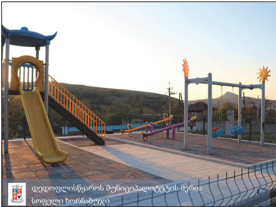
დედოფლისწყაროს მუნიციპალიტეტის მერია სოფელი ხორნაბუჯი