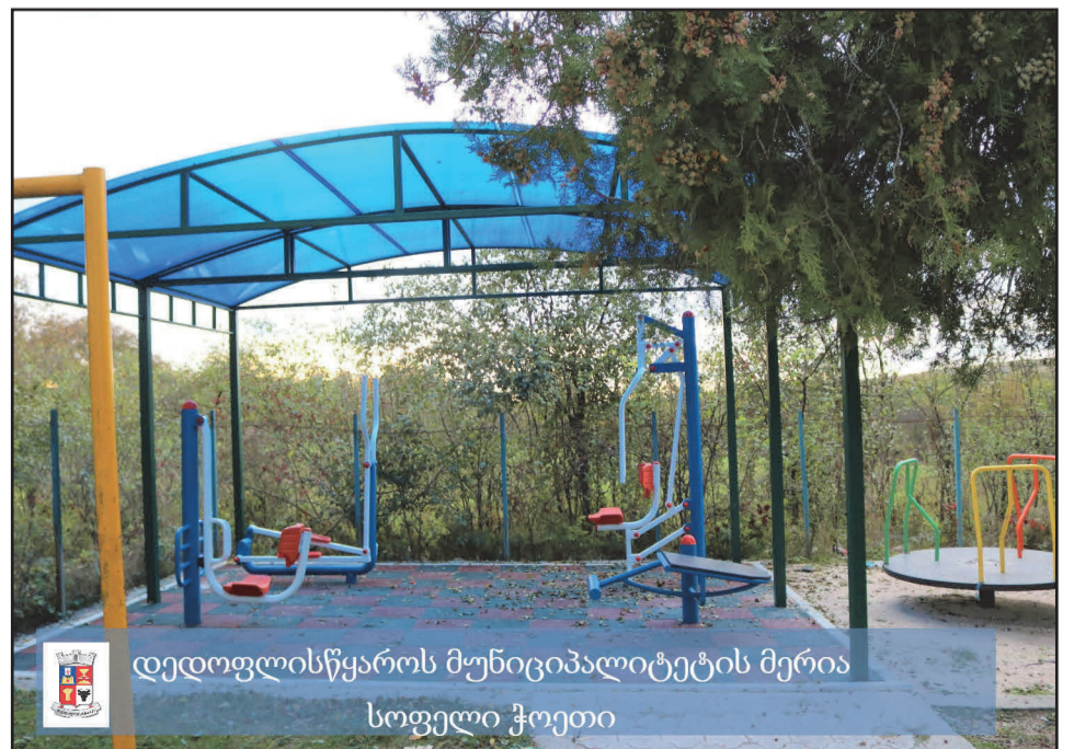
დედოფლისწყაროს მუნიციპალიტეტის მერია სოფელი ჭოეთი