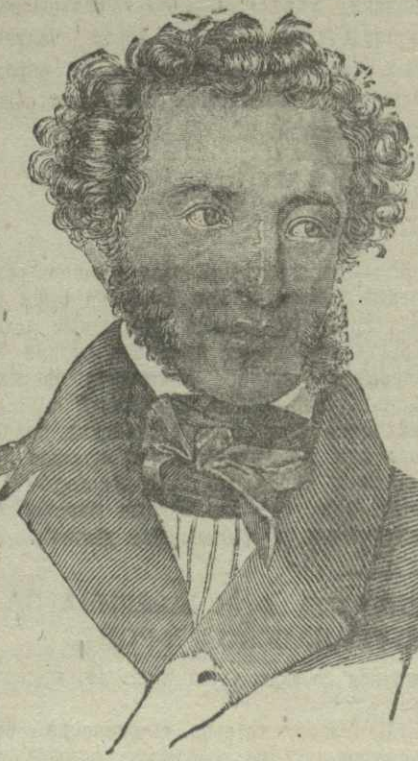
Гравировано на дереве А. П. Троцкий.

«Товарищ, верь, взойдёт она, Заря пленительного счастья, Россия вспрянет ото сна, И на обломках самовластия Намичнут новые имена!» Воспевая героическое прошлое русского народа, Пушкин гневно бичевал по-