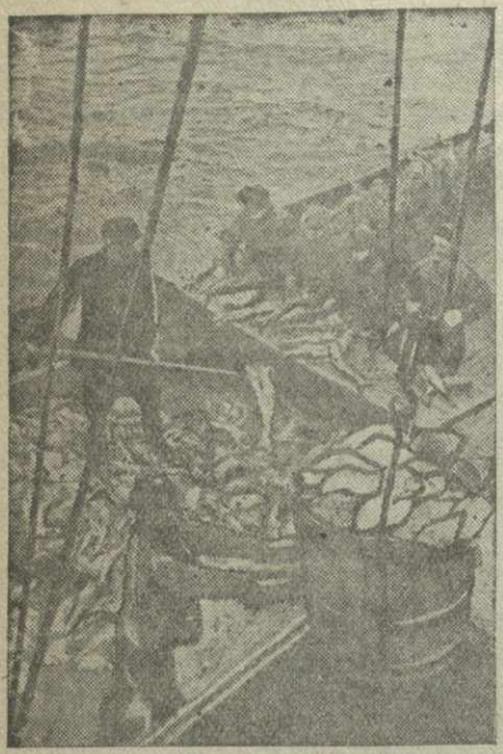
Баренцево море. В шторм и снег лодка...