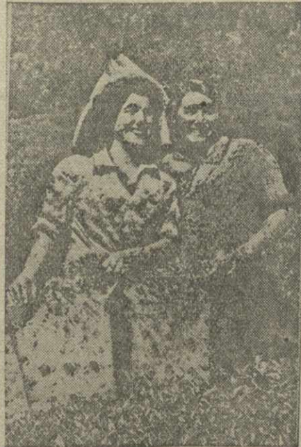
Коллектив Ахалского субтропического совхоза перевыполняет планы сбора зелёного чайного листа...