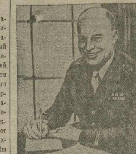
Верховный главнокомандующий экспедиционными силами союзников в Западной Европе генерал Дуайт Эйзенхауэр.

ЛОНДОН, 14 июня. (ТАСС). Штаб войск союзников в Италии сообщает, что, продолжая наступление, войска союзников в ряде мест перешли на Адриатическом участке фронта через реку Салине. Занят важный узел дорог Понди (в 30 километрах юго-западнее Кьети, на дороге Рим — Неаполь). Достигнут также предложение восточнее и западнее озера Вольсена. Ожесточённые бои происходят в районе Балвореджо (юго-западнее Орнито). Авиация продолжала свои налёты на войска противника и его военные объекты. Бомбардировке подверглись также неприятельские суда и пути сообщения на острове Корфуза, у побережья Юго-Славии. Прошлой ночью бомбардировщики авиации союзников совершили налёт на неприятельские объекты в Венгрии. Среднебомбардировщики союзников совершили около 1.100 самолётных вылетов. ЛОНДОН, 13 июня. (ТАСС). Агентство Рейтер сообщает, что на Адриатическом участке фронта противник оставил южный берег реки Некара. Части 5-й армии достигли пункта, расположенного в 120 километрах к северу от Рима. Занят пункт Канталупо, находящийся примерно в 20 км западнее Риги, на восточном берегу Тибра.