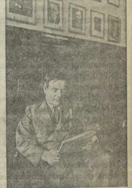
Недавно виденному советскому ученому академику Петру Леонидовичу Капине была вручена «Медаль Франклина». Эта медаль присуждается ему Институтом Франклина в Филадельфии за «выдающийся вклад в экспериментальную физику и в теоретическую физику, особенно в области магнетизма и физики температуры». На снимке — лауреат Сталинской премии академик П. Л. Капине в своем рабочем кабинете в Институте физических проблем Академии наук СССР.

В Центральной библиотеке литературы и искусства поступил совсем недавно из библиотеки Пушкинского Дома в Ленинграде документ, относящийся к тридцатым годам прошлого столетия. Среди них находится недатированное строк, написанное карандашом: «Медведево. А. С. Пушкин пробыл у нас два четверта. Он приезжал повидаться с нами и с Жуковским и с Вяземским». Документ представляет большой интерес. Биографам Пушкина факт встречи поэта с художницей, с Жуковским и Вяземским в Медведево до сих пор оставался неизвестным. (ТАСС).