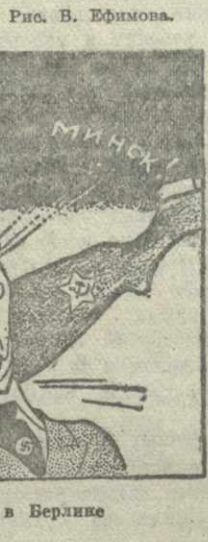
Искры из глаз в Берлине