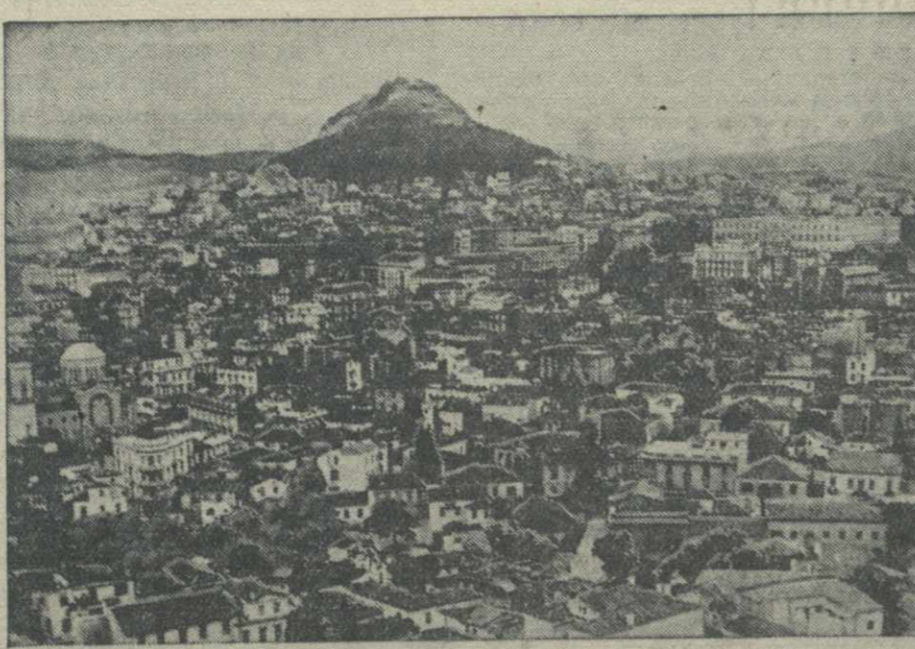
Афины—столица Греции.

Бай Цун-си указал далее, что, по его мнению, Япония не имеет возможности начать наступление на юг, так как она втянута в войну в Китае. Кроме того, Япония встречает здесь противодействие Англии и Америки.