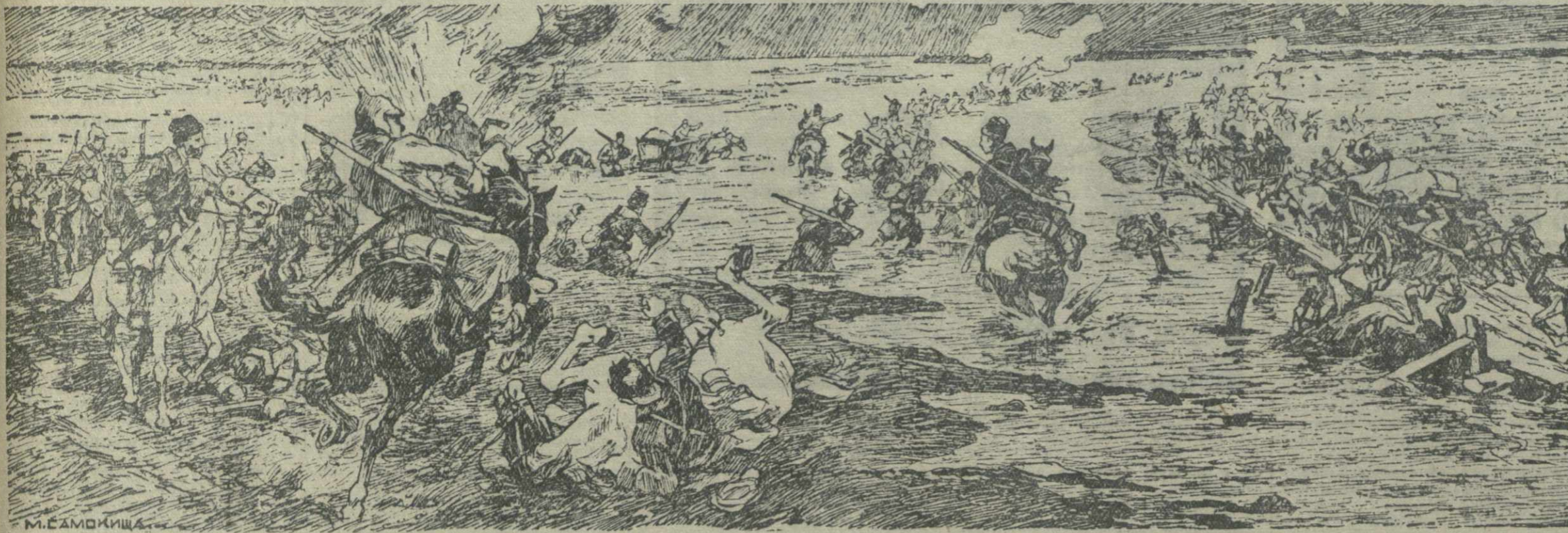
«Переход Красной Армии через Сиваш» — рисунок заслуженного деятеля искусства академика - орденосца М. С. Самокиша.