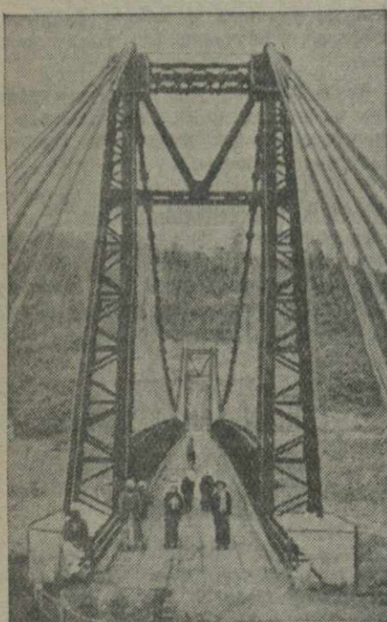
Мост на пути Бирма—Чунцин. (Репродукция из журнала «Фир»).