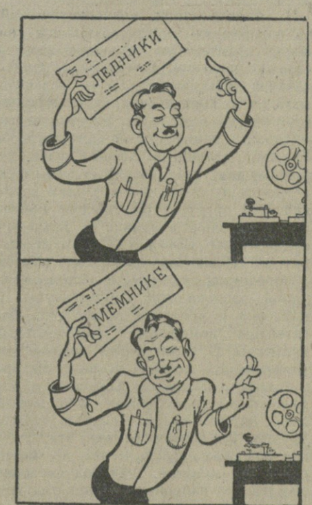
«Сосати сахар. Мемника! Вот вам мое «коммюнике».

Такая своеобразная «справка» приходит в Агаре почти вся телеграфная корреспонденция. Недобросовестность и рассеянность некоторых телеграфистов обходится государству весьма дорого. Рассеянность эта — от небрежности, равнодушия, расхлябанности, от нежелания точно выполнять свои обязанности. Г. ГАЗНЕЛИ.