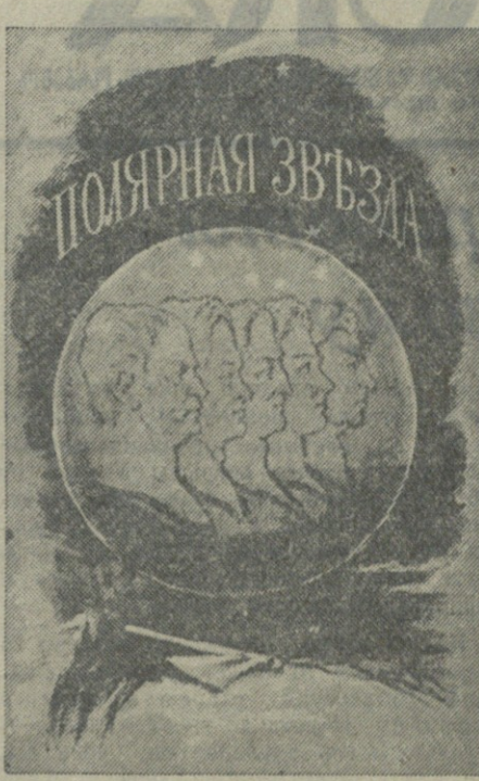
Издававшаяся А. И. Герценом «Полярная звезда» с изображением казненных декабристов.

Газета, приводя известные слова Рылеeva, произнесенные им перед казнью, пишет: «Восьмидесяти годовщина восстания декабристов совпадает с моментом всеобщей политической стачки, когда воспримущая от сна Россия, охваченная революционным пожаром, мобилизует свои силы для последней и