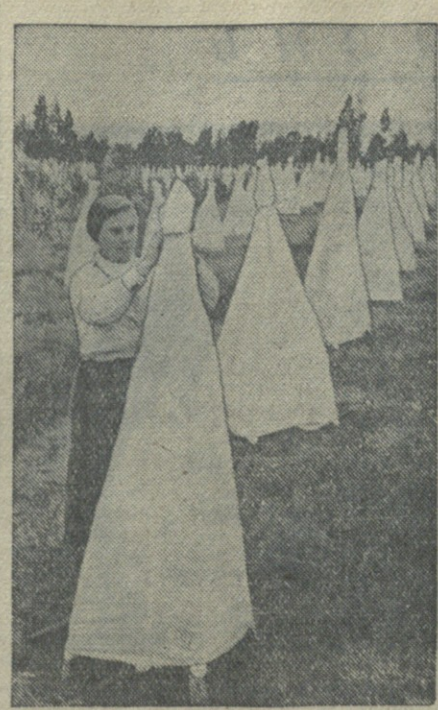
В совхозе «Грейпфрут» им. Л. П. Берия (Поти). На снимке: окутывание лимонов марлей.