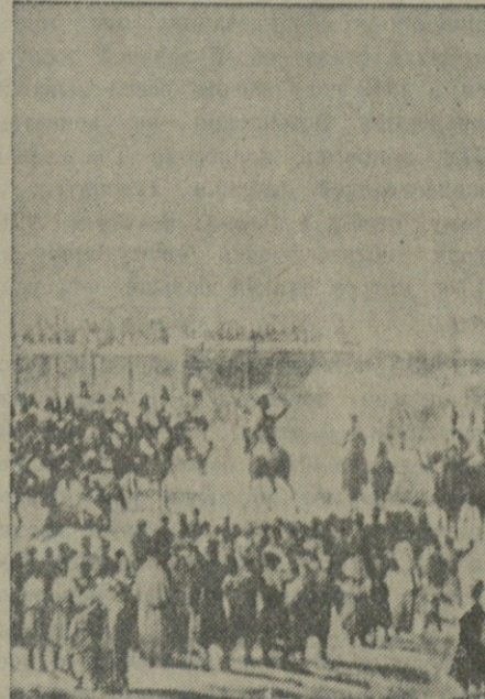
14 декабря 1825 года декабристы вывели войска на Сенатскую площадь Петербурга. (С акварели Колымага. Гос. музей имени А. С. Пушкина).

Газета писала, что многие из декабристов были убеждены, что потерят поражение в неравной схватке с правительством, но вдохновлялись мыслью, «что своей гибелью они послужат делу освобождения общества от убийственной деспотии и дадут толчок освободительному движению».