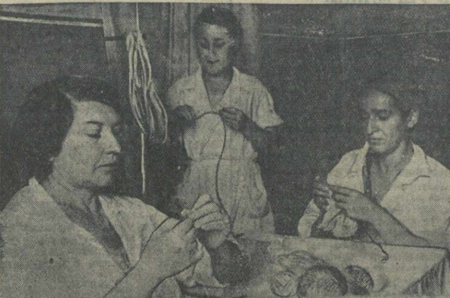
В 1-й городской поликлинике (Ленинский район) медицинские работники отдают свободное от работы время изготовлению теплых вещей для бойцов Красной Армии.