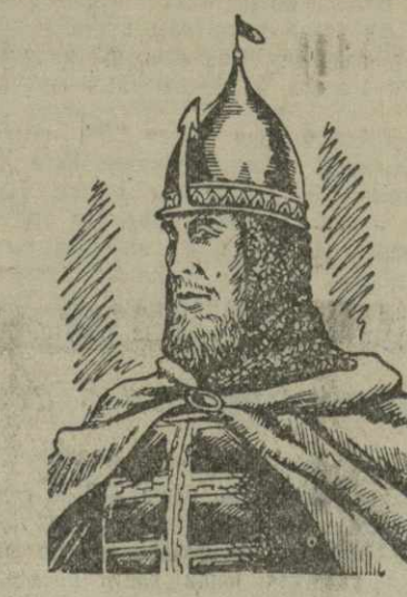
Первыми, в 1240 году, двинулись на Русь шведы. Во главе огромного шведского войска находился фактический правитель тогдашней Швеции Биргер, пользовавшийся славою необходимого завоевателя.

Тяжелое и тревожное время переживала тогда, в тринадцатом столетии, Русь. Опасность посябления грозила в те годы русской земле и со стороны немецких «псов-рыцарей» — предков нынешних гитлеровских разбойников и убийц, и со стороны шведских феодалов, пытавшихся поживиться добром богатых русских городов, поработить свободлюбивый русский народ.