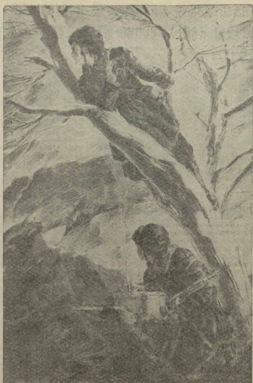
Л. Е. Фейнберг. Женщины в отечественной войне. Связистки.

Местные партийные и советские организации, политотделы МТС обязаны добиться образцового постановки учета в каждом колхозе.