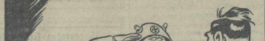
Фашистские дивизии прочно окопались... в советской земле!