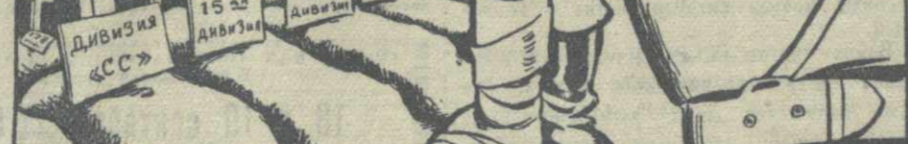
Фашистские дивизии прочно окопались... в советской земле!