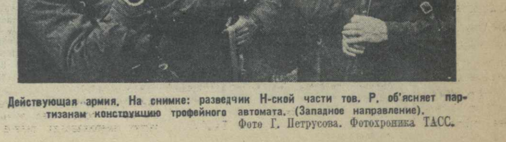
Действующая армия. На снимке: разведчики Н-ской части тов. Р. объясняет партизанам конструкцию трофейного автомата.

ЛОНДОН. (ТАСС). На состоявшемся в Бристолье массовом митинге была принята следующая резолюция: «Население Бристольа шлет самые теплые братские приветствия гражданам Одессы.