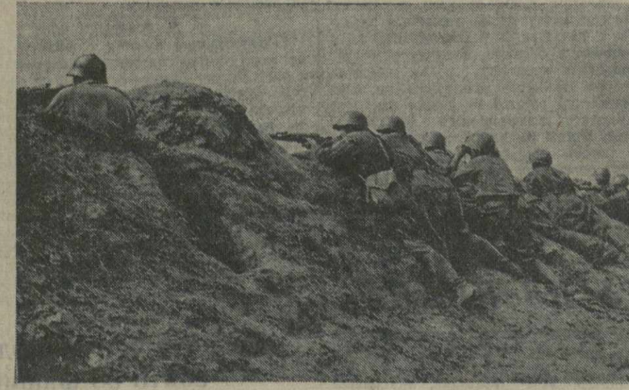
Действующая армия. На снимке: бойцы Н-ской части ведут огонь по фашистам.