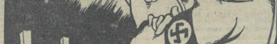
Фашистские дивизии прочно окопались... в советской земле!