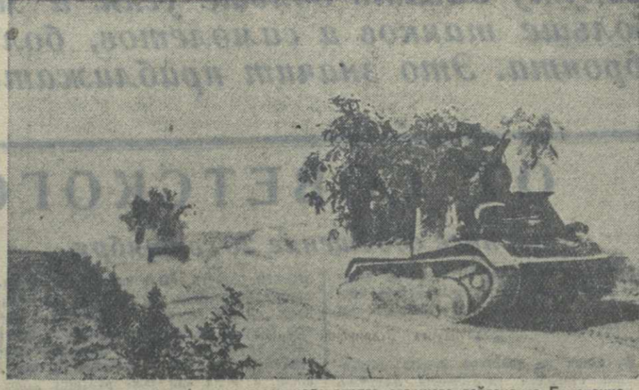
Действующая армия и флот. 1. Храбро сражаются в боях с альпийскими германскими дивизиями краснофлотцы десантного отряда старшего лейтенанта Ермоленко. На снимке: краснофлотцы на передовой линии фронта. 2. На передовую линию.