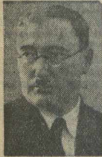
Академик И. С. Бериташвили, лауреат Сталинской премии

Победа никогда не доставалась грубой силой, несущей народом работу и порабощение. Тыраны - поработители след за временным успехом терпели жестокое поражение и оставили в истории лишь позорную память о себе. Человечество никогда не прощало кровавым апостолом войны и человеконенавистничества посягательства на совесть, на право и свободу, на завоевания труда, культуры, цивилизации. Гетлер и вся свора фашистских кровожадов будут уничтожены.