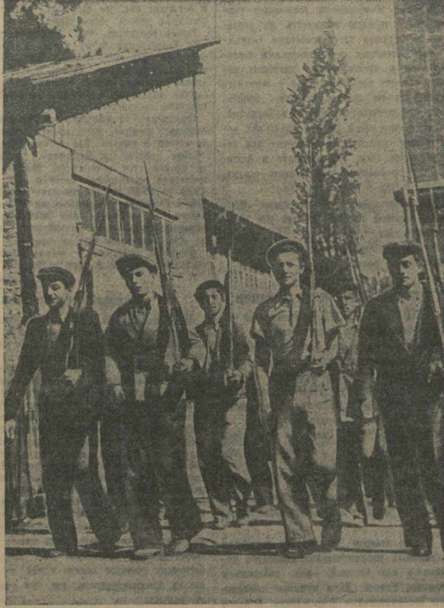
Бойцы-студенты Тбилисского индустриального института им. Нирова — на занятиях по стрелковой подготовке.