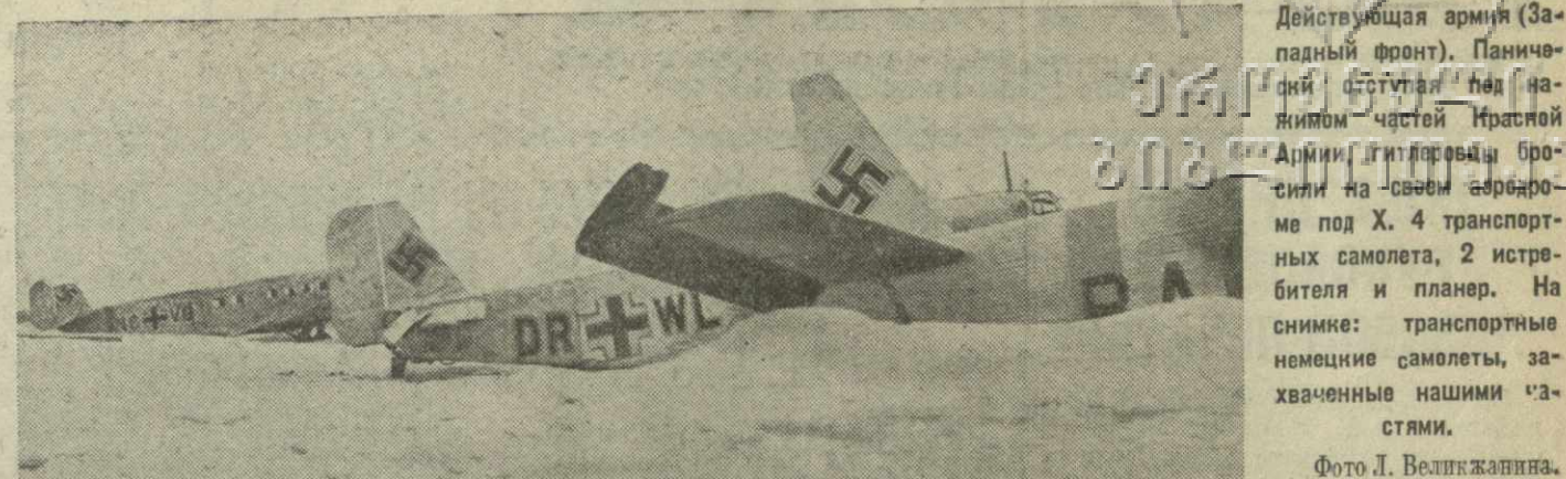
Действующая армия (Западный фронт). Панический беготня на железнодорожной станции Красной Армии. Гитлеровцы бросили на своем аэродроме под Х. 4 транспортные самолета, 2 истребителя и планер. На снимке: транспортные немецкие самолеты, захваченные нашими частями.