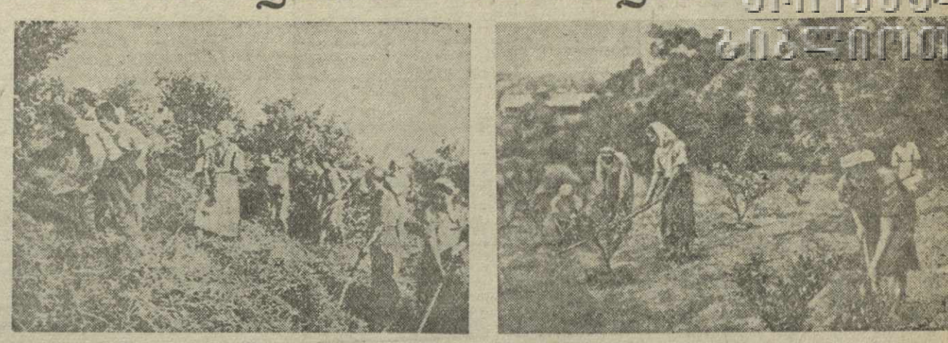
Колхоз имени Берия селения Отрадное Гагринского района. Цитрусоводческая бригада колхоза под руководством бригадира И. Агузмаяна ведёт расчистку плантации.