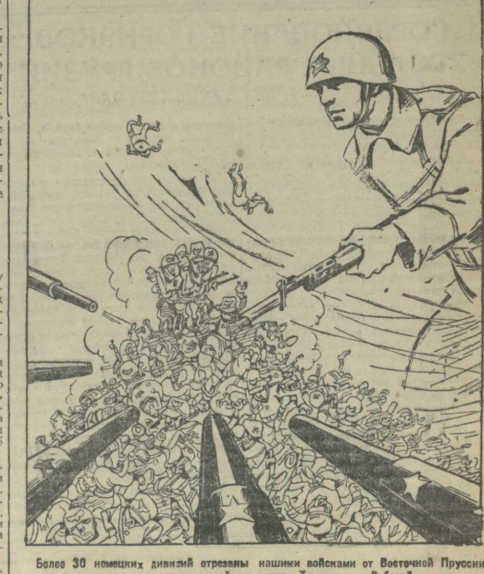
Более 30 немецких дивизий отрезаны нашими войсками от Восточной Пруссии и доколачиваются в районе Тунгусом и Либавой. Рисунок И. Гурбо.