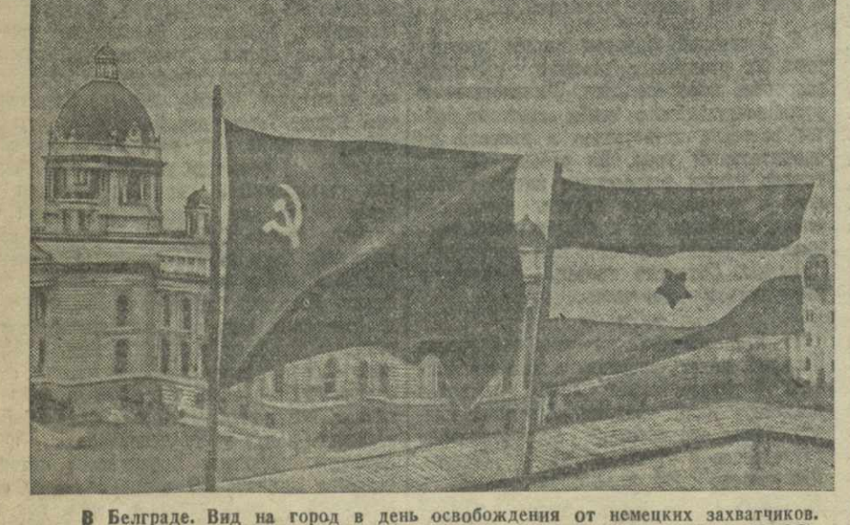
В Белграде. Вид на город в день освобождения от немецких захватчиков.

РМГА, 6 ноября. (ТАСС). Указом Президиума Верховного Совета Латвийской ССР П. И. Валескали назначен Народным Комиссаром Иностранных Дел республики.