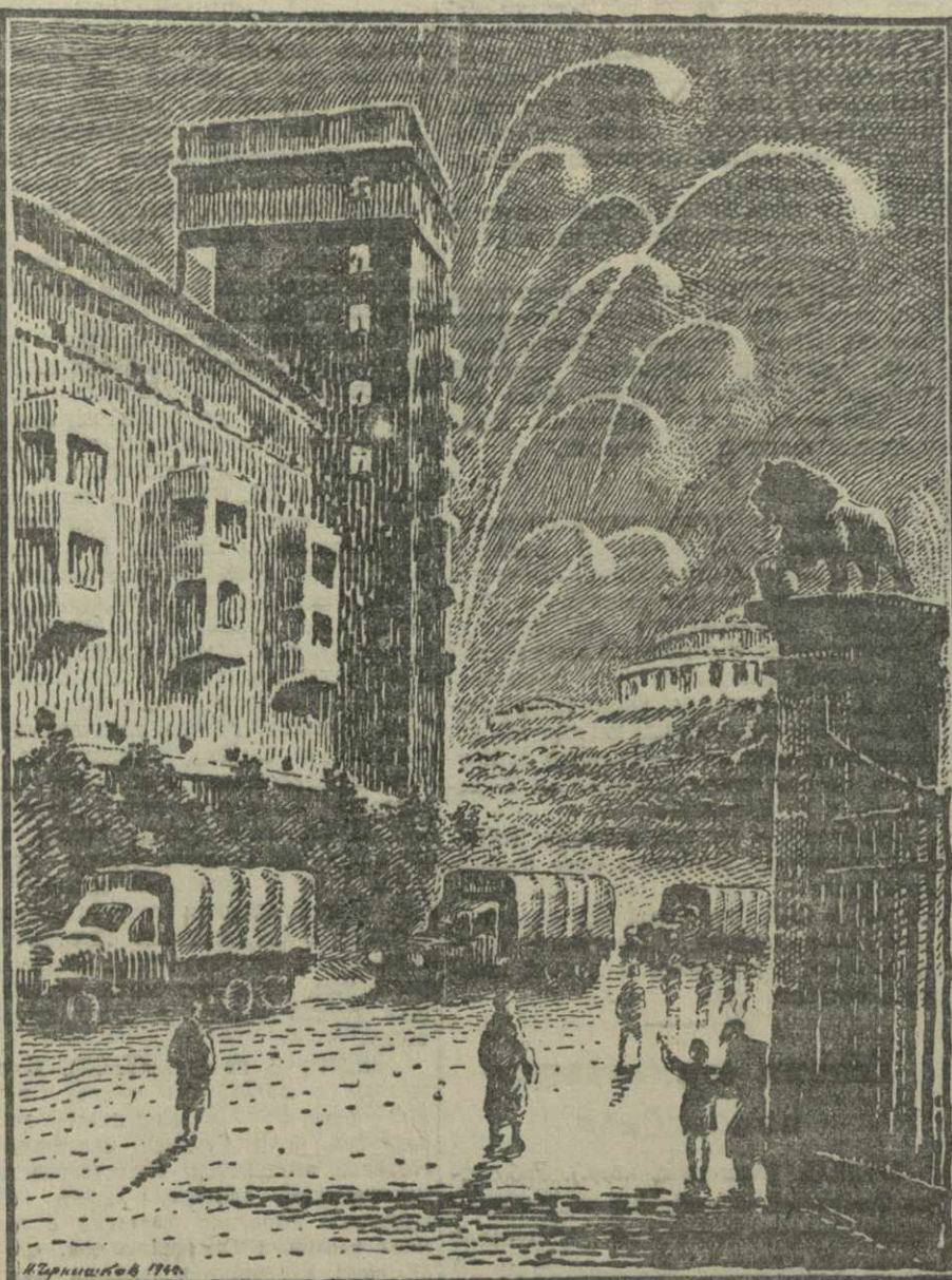
Салют в Тбилиси в честь XXVII годовщины Октября. На площади Героев Советского Союза. Рисунок худ. Н. Чернышкова.

Один за другим выступают участники собрания. Они говорят о том, как надо работать теперь, чтобы оправдать оценку, данную товарищем Сталиным бойцам советского тыла, чтобы приблизить желанный час, когда красное знамя будет водружено над Берлином. С. ЮРЬЕВА. Г. КАЧКАЧИВИЛИ.