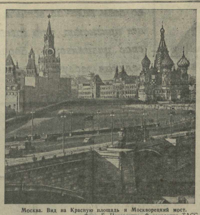
Москва. Вид на Красную площадь и Москворецкий мост.

Люди покидают зал, преисполненные незабываемыми впечатлениями, как никогда веря в близкую победу нашего правого дела. (ТАСС).