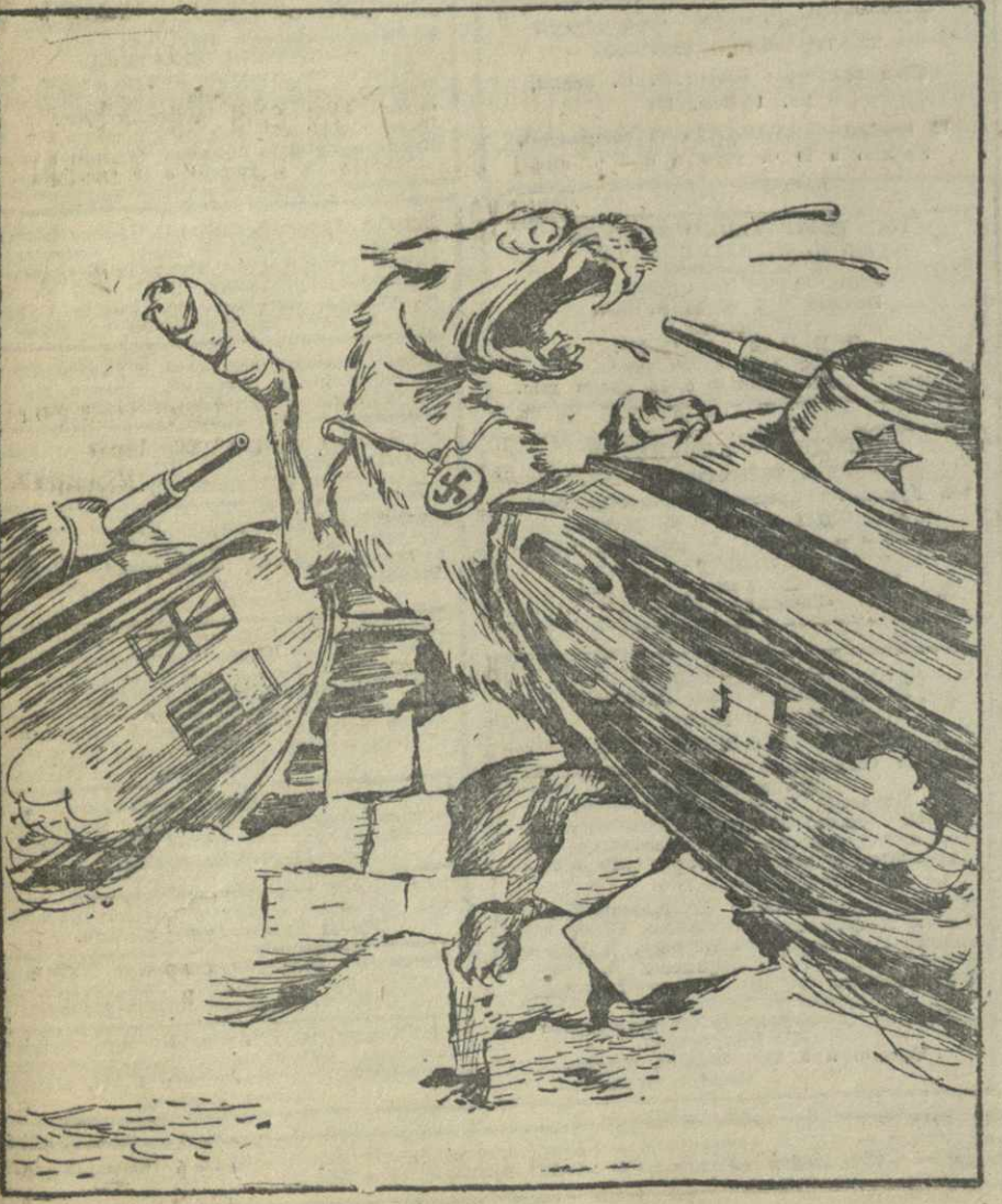
Германия занята в тиски между двумя фронтами. Рисунок И. Гурбо.

тузного цеха т. В. Грибанов, бригадир молодой бригады т. Р. Поплаев, бригадир-механик патронно-набивного цеха т. Ставешки. Коллектив табачной фабрики в ответ на доклад вождя взял обязательство выполнить ноябрьскую производственную программу на 5 дней раньше срока, дать стране и фронту сверх плана 3 тонны табака и 2 миллиона штук папирос, снизить себестоимость продукции на 2 процента против плана.