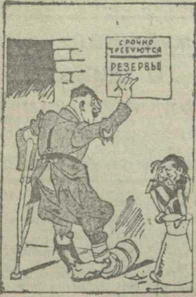
Рис. В. Ефимова