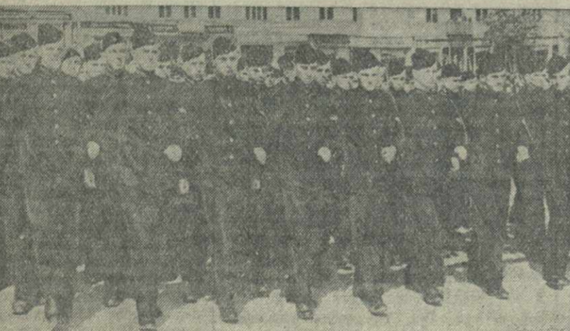
Демонстрация трудящихся Тбилиси 1 мая. На снимке (слева направо): учащиеся спецшколы военно-воздушных сил, колонна физкультурников.

... Стекля часов приближалась к семи, когда последние колонны демонстрантов покинули Красную площадь. Около 5 часов продолжалось это величайшее, невиданное по своей грандиозности шествие. Свыше 1.800 тысяч трудящихся Москвы участвовало в праздничной первомайской демонстрации. (ТАСС).