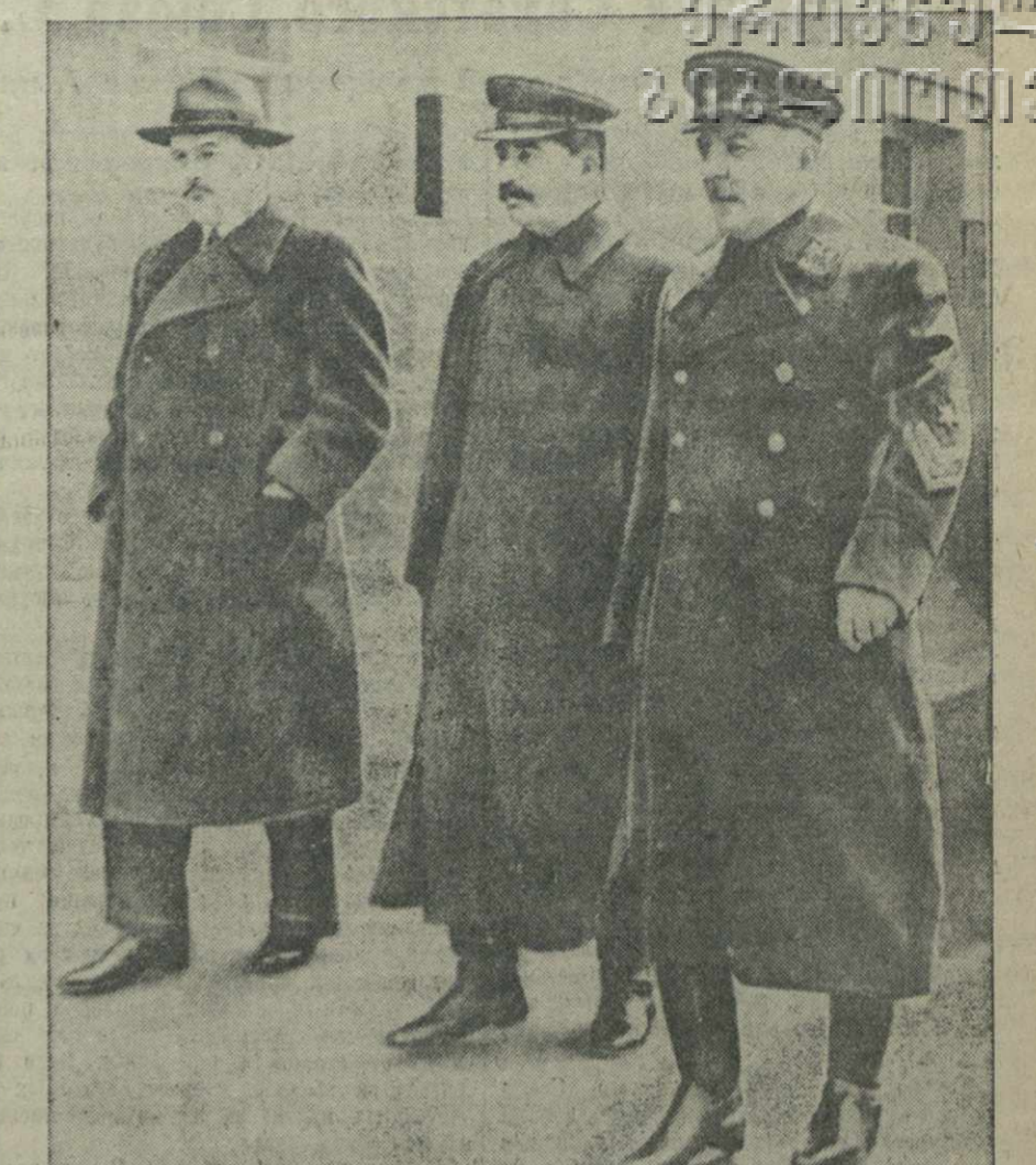
Празднование 1 мая в Москве. Товарищи И. В. СТАЛИН, В. М. МОЛотов и К. Е. ВОРОШИЛОВ направляются из Кремля на Красную площадь. (Снимок передан из Москвы по быдлааппарату).

Перед мавзолеем один за другим проходят эскадроны кавалерии. Их сменяют подразделения самокатчиков. Бесшумно