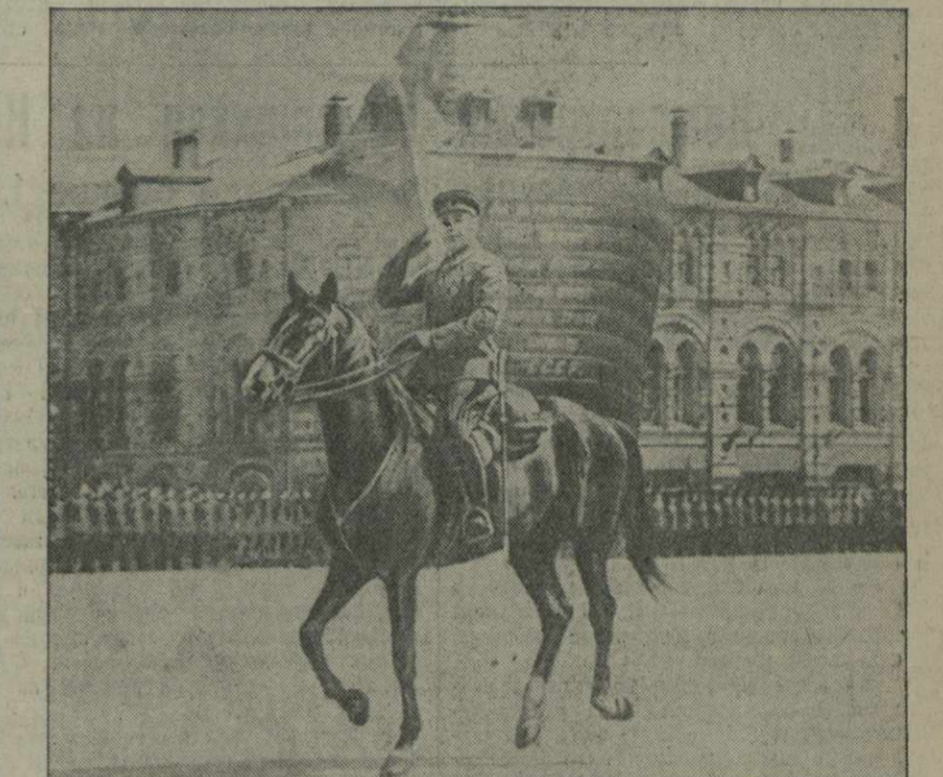
Празднование 1 мая в Москве. Народный Комиссар Обороны Герой и маршал Советского Союза товарищ С. К. Тимошенко приветствует войска на параде. (Снимок передан из Москвы по быдлааппарату).

проезжает сводный полк велосипедистов спортивных обществ столицы.