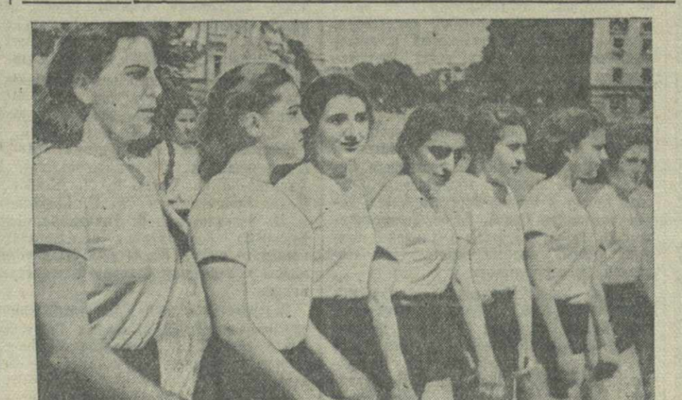
Учащиеся спецшколы военно-воздушных сил, колонна физкультурников.