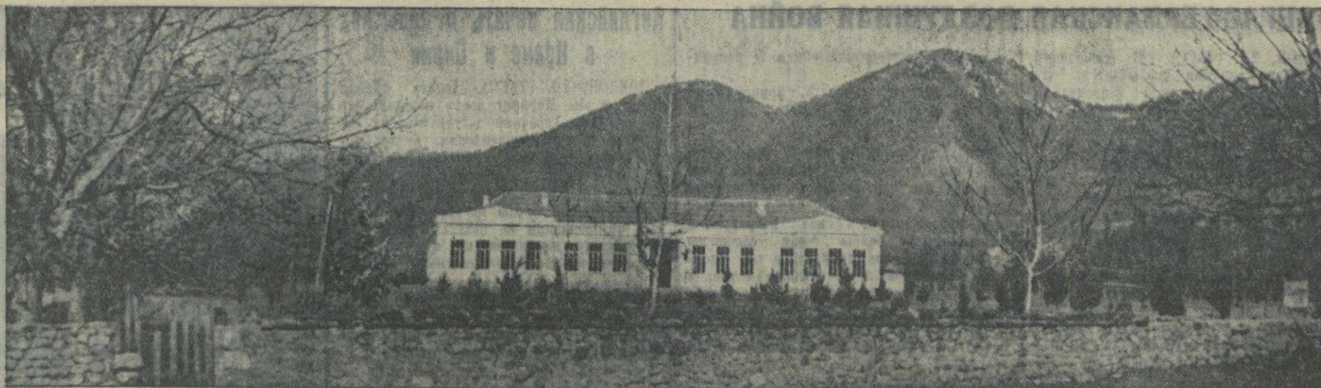
Новая школа в колхозе-миллионере имени ЛЕНИНА сел. Окуми (Абхазская АССР).