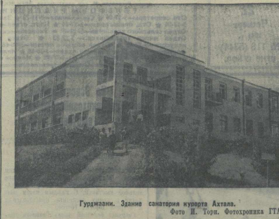
Гурджаани. Здание санатория курорта Ахтала.

Буржуазия кровно заинтересована в том, чтобы скрыть от народных масс империалистический, грабительский характер выношенной войны. Во всех воюющих странах господствующие классы твердят, что они ведут войну только за справедливость, за право своего народа, за то, чтобы отвоевать для него жизненно-необходимое. Церковь помогает буржуазии скрывать от народных масс истинные цели войны, она дает моральное и религиозное оправдание войне. Попы каждой воюющей страны утверждают, что война «неизбежна» данному государству противником: мы, де, война не хотели, нам ее навязали, а потому надо воевать. Народные массы хотят знать, в чем кроются причины войны? Есть ли один правильный ответ на вопрос о природе империалистических войн. О причинах войны при империализме Ленин в 1914 г. писал: «Война не случайность, не «грех», как думают христианские попы (проповедующие патриотизм, гуманизм и мир не хуже оппортунистов), а неизбежная ступень капитализма, столь же законная форма империалистической жизни, как и мир». (Ленин, т. XVIII, стр. 70).