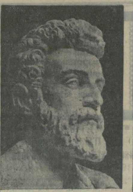
Ладю Кецохели. Бюст работы скульптора Г. Сеснашвили.