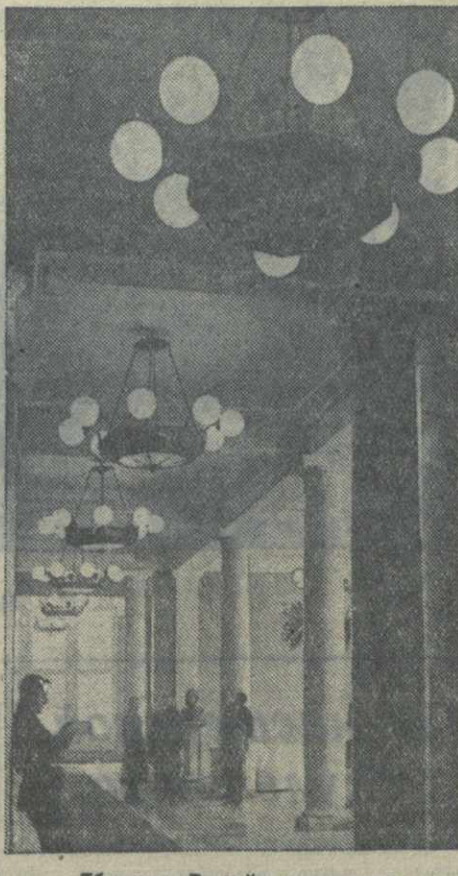
Тбилиси. В фойе кинотеатра имени Руставели.