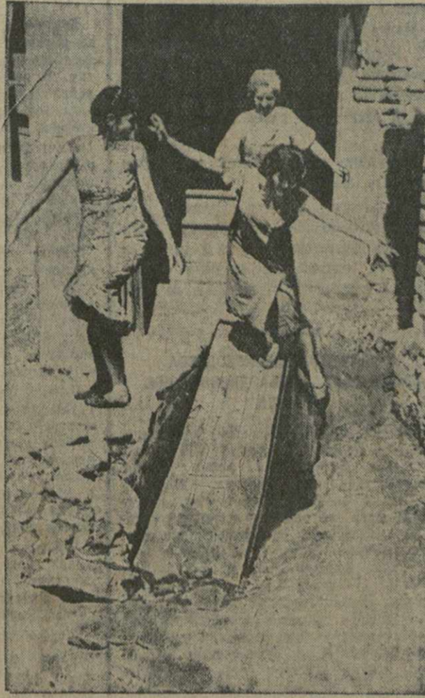
(Снимок сделан 5 июня).

Разрешение на постройку дома № 6 по улице Амо выдано плано-архитектурным отделом исполкома Тбилисского Совета. За производством работ, которые велись технически неграмотно, никто не следил. Здесь вместо помещения для учреждения в основном построили квартиры для работников бытия. Главиништоргартора, ныне Главиништоргторга СССР. Этот дом много раз подвергался самостоятельным переделкам, которые привели к самым неожиданным результатам.