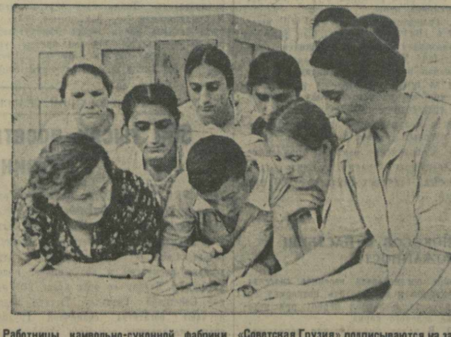
Работницы навозильно-суконной фабрики «Советская Грузия» подписываются на заем.