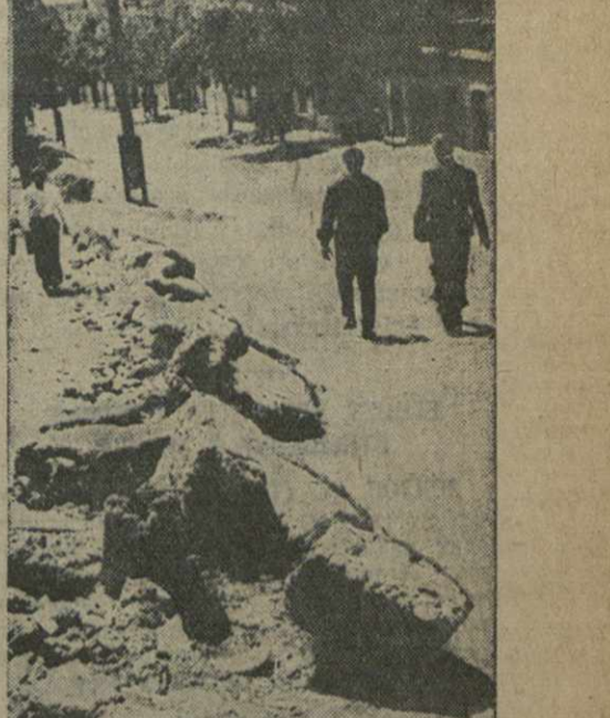
Фото документ. Так выглядит тротуар по улице 9 января. Развалившаяся стена преграждает путь пешеходам, и они вынуждены ходить по мостовой.

(Снимок сделан 5 июня).