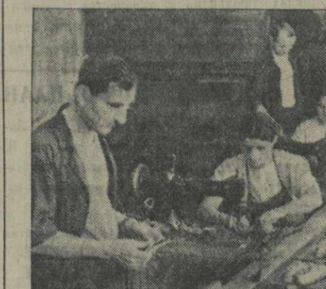
На Тбилисской обувной фабрике № 2 им. Молотова. У недавно установленного на фабрике конвейера.

Борьба за дальнейший технический прогресс предприятия, добиваясь лучшей организации труда, решительно спихать себестоимость — таковы важнейшие задачи коллектива завода в 1941 году.