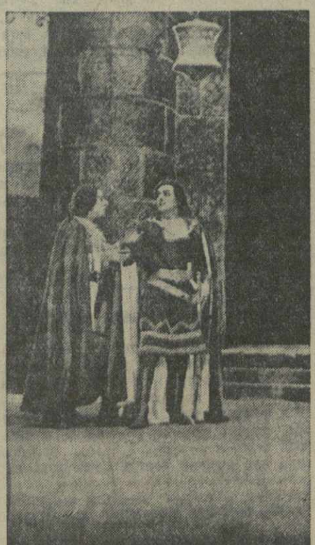
«Король Лир». Сцена 3-й картины 1-го действия. Оформление художника Д. Какабадзе.

республики А. Исаишвили. Огромный сценический опыт и блестящее дарование дают возможность артисту донести до зрителя полный внутренних противоречий образ Лира. На всем протяжении трагедии Лир для сценического воплощения роли ему удается сохранить беспримесный парастатуи шекспировский ритм. С исключительной убедительностью проводит он сцену встречи с дочерями, отвергнутыми им.