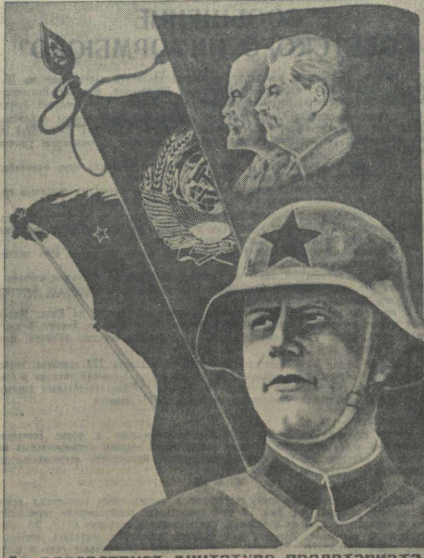
Да здравствует диктатура пролетариата, родившая Красную Армию, давшая ей победу и увенчавшая ее славой!

Анастасий Е. ТАРЛЕ, Ленинград, 23 июня. (ТАСС).