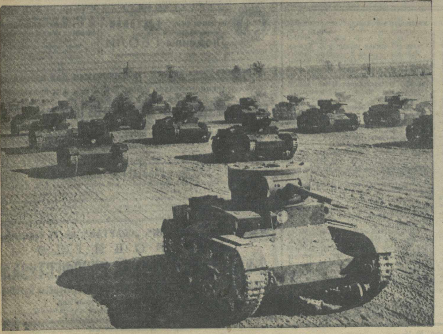
Советские танки на учениях.

Да здравствует гений человечества, великий вождь трудящихся, наш родной Сталин!