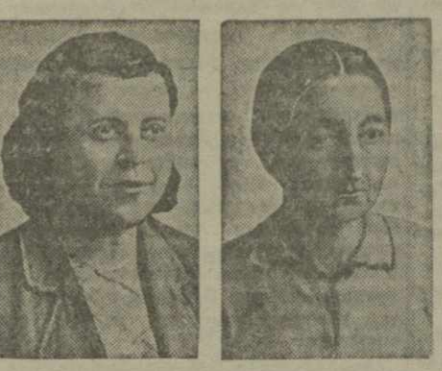
Передовые работницы шахты «Гелати» тresta «Гкибулуголь»...