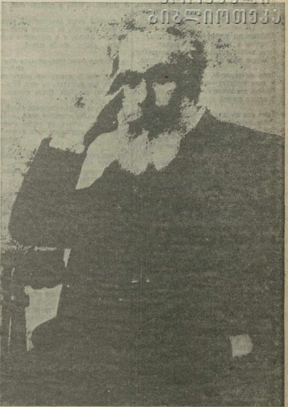
Акакий Церетели — великий поэт грузинского народа, слава и гордость грузинской литературы, несравненный мастер слова, воплощенный в своем творчестве сокровенные думы и чаяния трудовых масс.

В течение всей своей жизни Акакий Церетели был крепко связан с трудовым народом, боролся против произвола и угнетения, против рабского положения крестьянства. Он был по-настоящему поэтом и наряду с Ильей Чавчавадзе