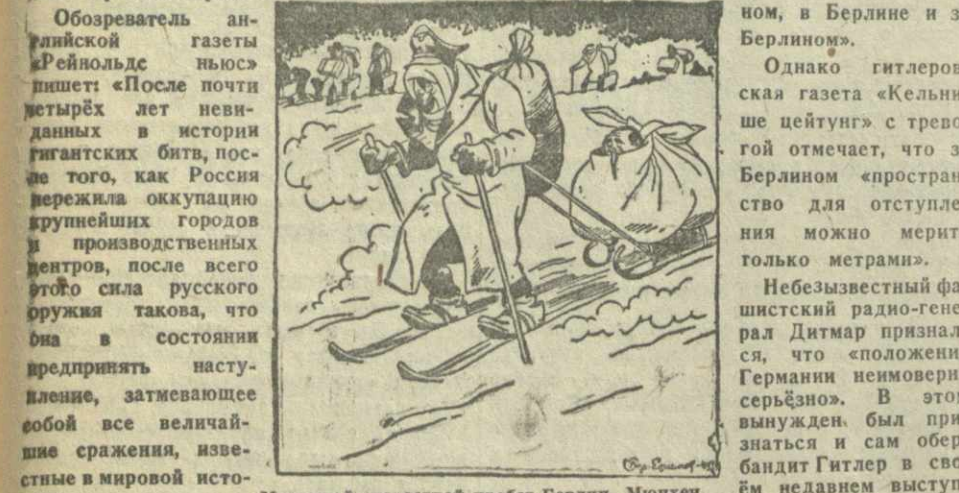
Массовый скоростной пробор Берлин-Мюнхен.

Внимание всего мира приковано к победоносному наступлению Красной Армии.