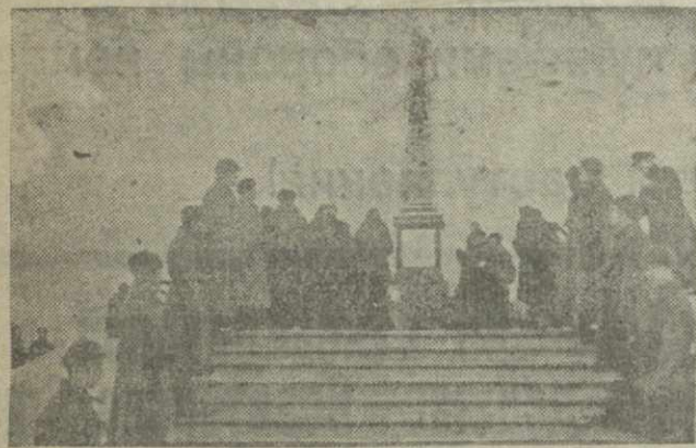
Недавно состоялось торжественное открытие памятника-обелиска славным защитникам Ленинграда, оставившего на развалине дорог Красное Село—Стрельна.