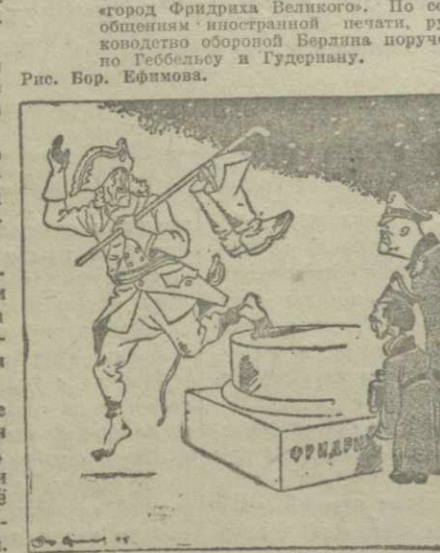
Фридрих II. — Я уже одержал «оборону» Берлин от русских. С меня хватит, господа. Показ.

В Берлине радио истерично призывало немцев обороняться. По сообщению «Иностранной печати», руководителем обороны Берлина поручено Гейбелю и Гудерману.