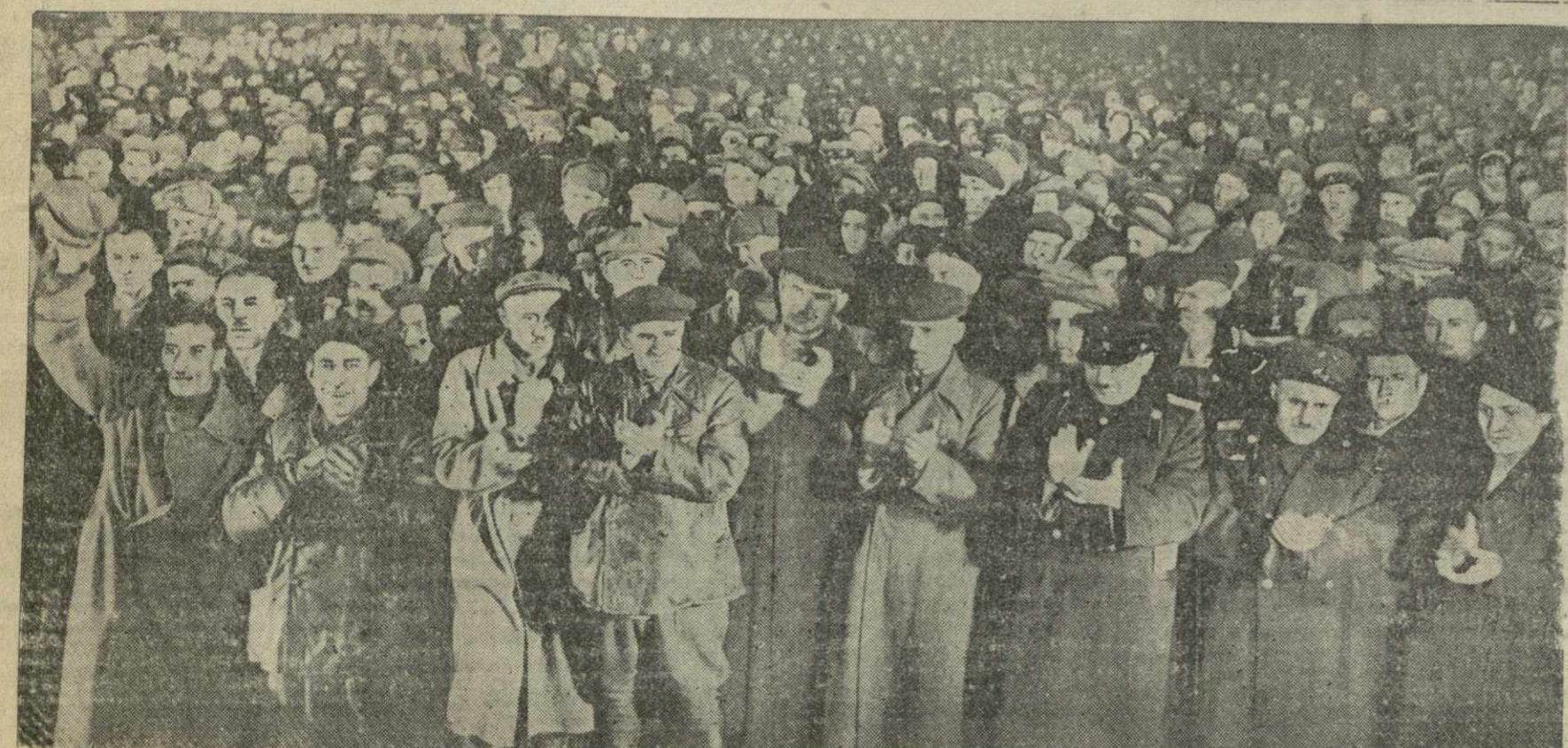
На предвыборном собрании рабочих и служащих паровозо-вагоноремонтного завода имени Сталина 2 января.

В неразрывном союзе и тесном единении с большевиками беспартийные рабочие, служащие, инженеры выдвигают кандидатами в депутаты Верховного Совета СССР тех, кто непоколебимо идет по ленинско-сталинскому пути, кто любит нашу прекрасную родину и предан партии Ленина—Сталина, кто не дрогнет в минуту опасности, кто видит цель своей жизни в служении интересам трудящихся, интересам народа.