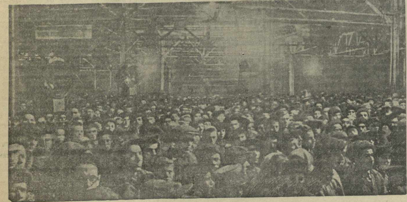
На предвыборном собрании рабочих и служащих завода имени Димитрова 2 января.