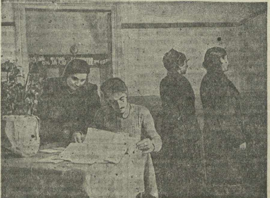
На избирательном участке № 90 Тбилисского — Сталинского избирательного округа. Проверка фамилий в списках избирателей.