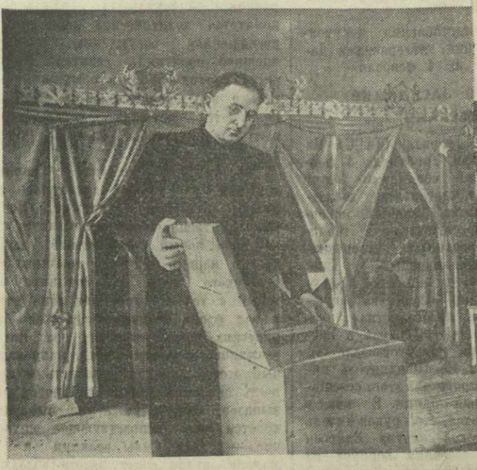
Тбилиси. На избирательном участке № 12 заканчивается кабинет для голосования.