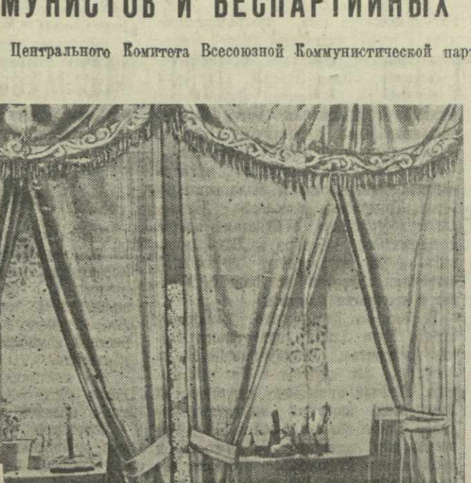
Тбилиси. На избирательном участке № 12 заканчивается кабинет для голосования.