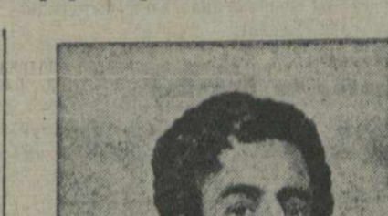
Восной 1812 года против патуляционной армии Наполеона, сосредоточившейся на Пскове, воевал дед русский армии. В 1-й армии, которой командовал Барклай-де-Толли, было 118 тысяч солдат, а во 2-й, находившейся под начальством Багратиона, — всего 25 тысяч.

Полчища Наполеона, перейдя границу России, пытались окружить обе армии. Барклай-де-Толли, чтобы спасти армию, начал отход к Смоленску. Приказав было отступить и Багратиону, в том, чтобы соединиться с армией Барклая, Наполеон стремился помешать этому соединению и торопил своих генералов покончить со второй армией. Последующим войсками маршала Дана, Багратион искусно вывел из скимпаных его французских пленцев. Наполеон славные контрудары протали и Багратион, он отступил к Смоленску, где и соединился с 1-й армией.