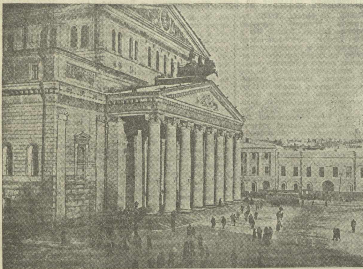
Москва, Государственный ордена Ленина Академический Большой театр Союза ССР.