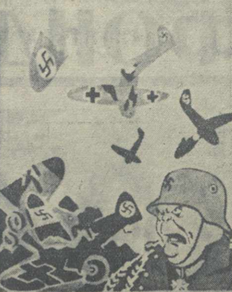
ВОЗДУШНЫЕ СИЛЫ ГЕРИНГА С КАЖДЫМ ДНЕМ ИХ СТАНОВИТСЯ ВСЕ МЕНЬШЕ И МЕНЬШЕ.