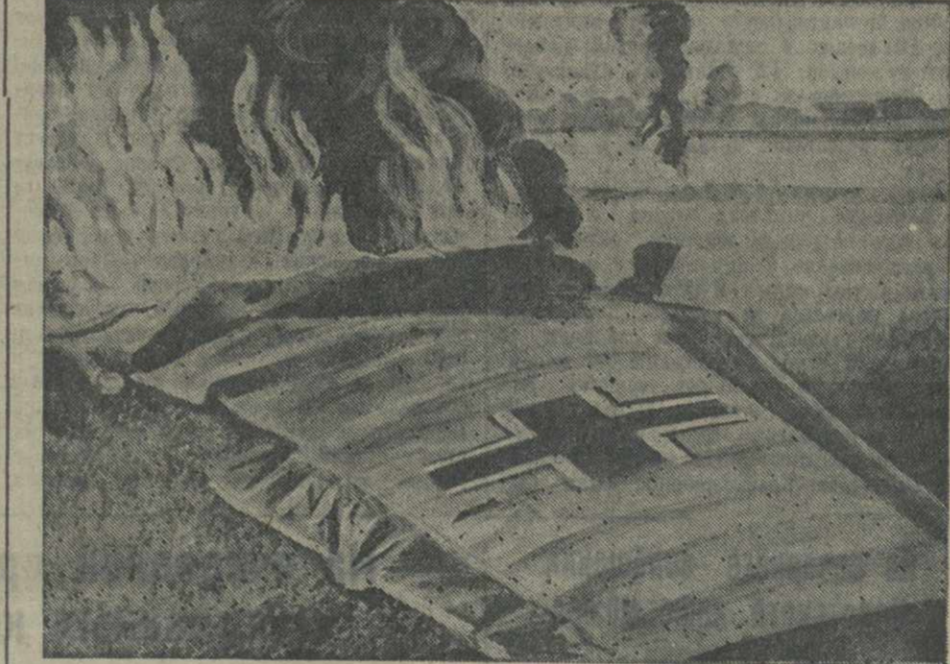
Действующая армия. На снимке: последние минуты сбитого фашистского стервятника.