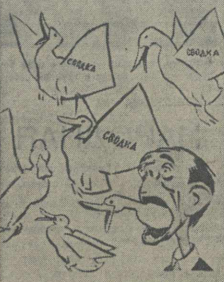
ВОЗДУШНЫЕ СИЛЫ ГЕББЕЛСА С КАЖДЫМ ДНЕМ ИХ СТАНОВИТСЯ ВСЕ БОЛЬШЕ И БОЛЬШЕ.