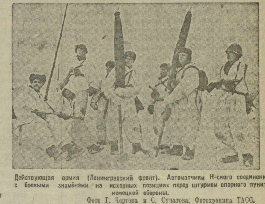
Действующая армия (Ленинградский фронт). Автоматчики Н-ского соединения с боевыми знамёнами на исходных позициях перед штурмом опорного пункта немецкой обороны.

Приморский краеведческий музей (г. Владивосток) приобрёл почитное оружие — клинок, вручённый одному из командиров в связи с годовщиной десятилетия Отечественной войны 1812 года. Рукоятка клинка — из слоеной кости, вдоль лезвия золотом выгнана гирлянда лавровых листьев, на которых выгравированы названия городов и селений, расположенных на пути, по которому русская армия преследовала противника. На первом листе гирлянды выгравировано: «Москва 6 октября 1812 года». Далее идут Тарутино, Малоярославль, Вязьма, Минск, Березина — последний русский город, датированный 13 ноября. На следующих листьях обозначены города Германии, в том числе Кёнигсберг; Берлин, Дрезден, Лейпциг и другие.