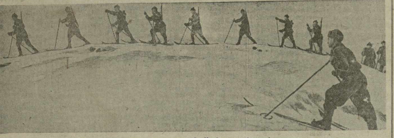
Разведчики Н-ской части под наблюдением младшего лейтенанта С. Хлебникова (справа) тренируются в хождении на лыжах.

За неделю с 14 по 20 февраля английская авиация потеряла на всех фронтах 165 самолётов. Противник потерял за то же время 109 самолётов. В ряде городов Норвегии были устроены недавно польные полинейские облавы. В Тронхейме арестовано 150 человек, в Осло — 50. Крупные аресты произведены также в ряде других районов страны. В Румынии распущен союз офицеров запаса. Русуск его мотивируется тем, что этот союз не проявлял с начала войны никакой деятельности. (ТАСС).