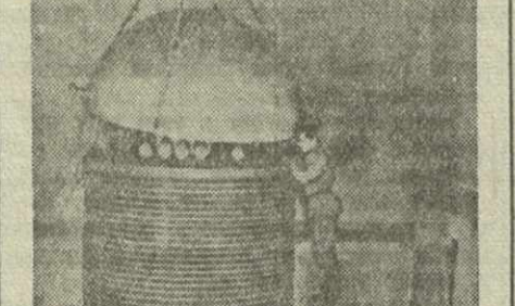
Вернувшись на эвакуацию научные работники высочайшей лаборатории Харьковского филиала-технического института Академии наук УССР широко развили работу по восстановлению оборудования лабораторий. На снимке: фото нейтронного генератора на 15 микронной длине волны.

16. Область Наркомзем, райисполкомы и райкомы КП(б) Грузии: а) проверить в каждом колхозе выполнение заданий по закладке парников овощных культур, а также утешительный гряд для выведения ранней рассады и принять меры к полному обеспечению установленного настоящим постановлением плана сев овощных культур здоровой, хорошо развитой рассадой; б) для овощных культур выделить лучшие земельные участки, преимущественно поливные, и на неудобрённые осенью участки внести лавовое и другие местные удобрения; обеспечить качественную предпосевную раскиску почвы; в) разъяснить правдивым колхозам, что, наряду с хорошей обработкой и уходом за огородами, одним из основных мероприятий по повышению урожайности овощных культур, является соблюдение установленных агроправилами густоты стояния растений. Поэтому, при посадке и севе овощных культур строго соблюдать установленные нормы посадки, систематически проверять состояние посевов и посадок, немедленно заменяя вышедшие растения посадкой новых и не допуская изреженности посевов в огородах; г) в течение вегетационного периода посевы овощных культур держать в чистом и чистом от сорняков состоянии, путём проведения многократной пропашки и рыхления; в зависимости от состояния влажности почвы, проводить полив посевов овощных культур.