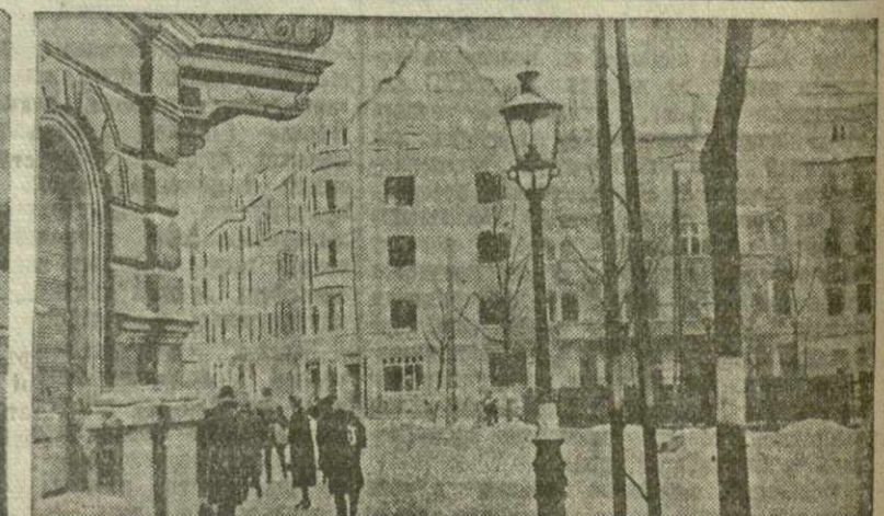
Первый Белорусский фронт. Одна из центральных улиц освобожденного Красной Армией города Познань.