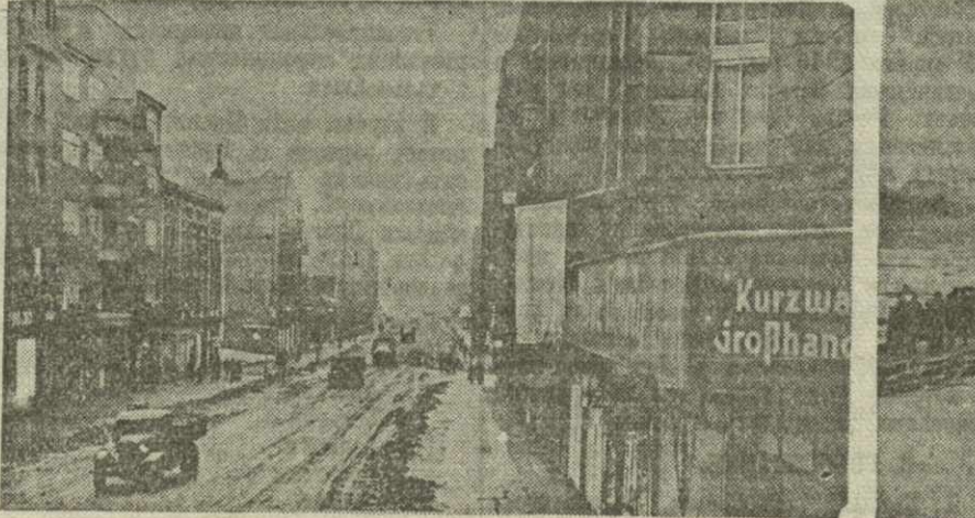
Первый Украинский фронт. В немецкой Силезии. В городе Гинденбург, занятом советскими войсками.

Комиссия отметила успешное проведение с.х. работ в 1944 г. в Нарезанском и Лайтурском чайных совхозах треста «Чайсовхоз-Грузия».