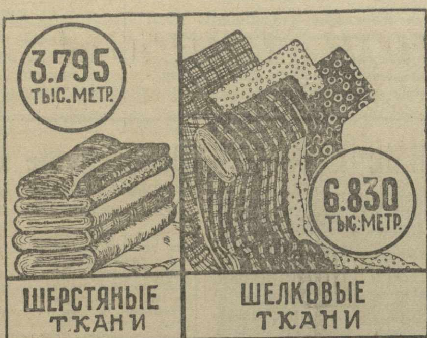
ПЛАН ПРОИЗВОДСТВА ТКАНЕЙ ПО ГРУЗИИ НА 1950 ГОД

Одновременно с пензенской вступает в эксплуатацию и первая очередь хлопчаткакой фабрики. Здесь пока в работе будут находиться 75 станков и до конца года вступят еще 125 станков. В 1946 году фабрика должна выработать 1 миллион метров хлопчатобумажных тканей, в дальнейшем же выработка готовой продукции будет