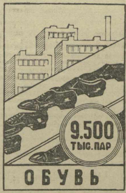
План производства обуви по Грузии на 1950 год.

Мы имеем школу ФЗО на 150 человек с годичным сроком обучения. Многие рабочие проходят на фабрике индивидуальное—бригадное обучение, вовлечены в стахановские школы. Недавно организовано 11 кружков техникума с общим числом слушателей в 220 человек. Вторым професием на фабрике обучается 20 человек. В апреле будут организованы курсы по подготовке начальников и