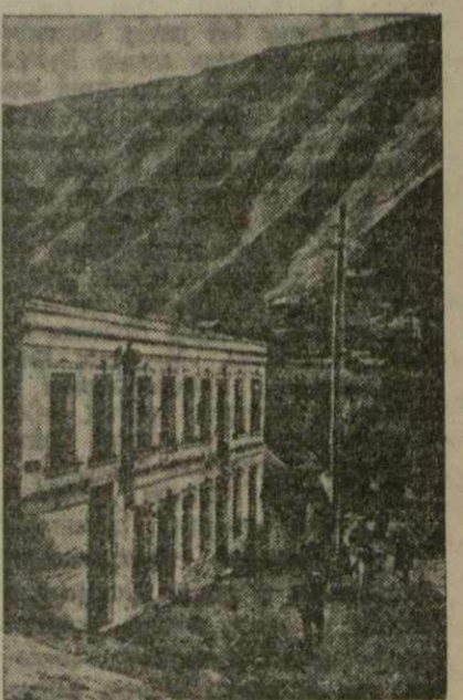
Тбилиси. Дом № 8 по бывш. Церковному под'ёму, где находилась нелегальная типография большевистской газеты «Тифлисский пролетарий».

Издавая большевистских организаций Закавказья, несмотря на тяжёлые условия подполья, отвечали основным требованиям печатной техники. Это вносило в заблуждение царских охранников. В 1910 году тифлисское охранное отделение тайно старалось обнаружить типографию, печатавшую нелегальную