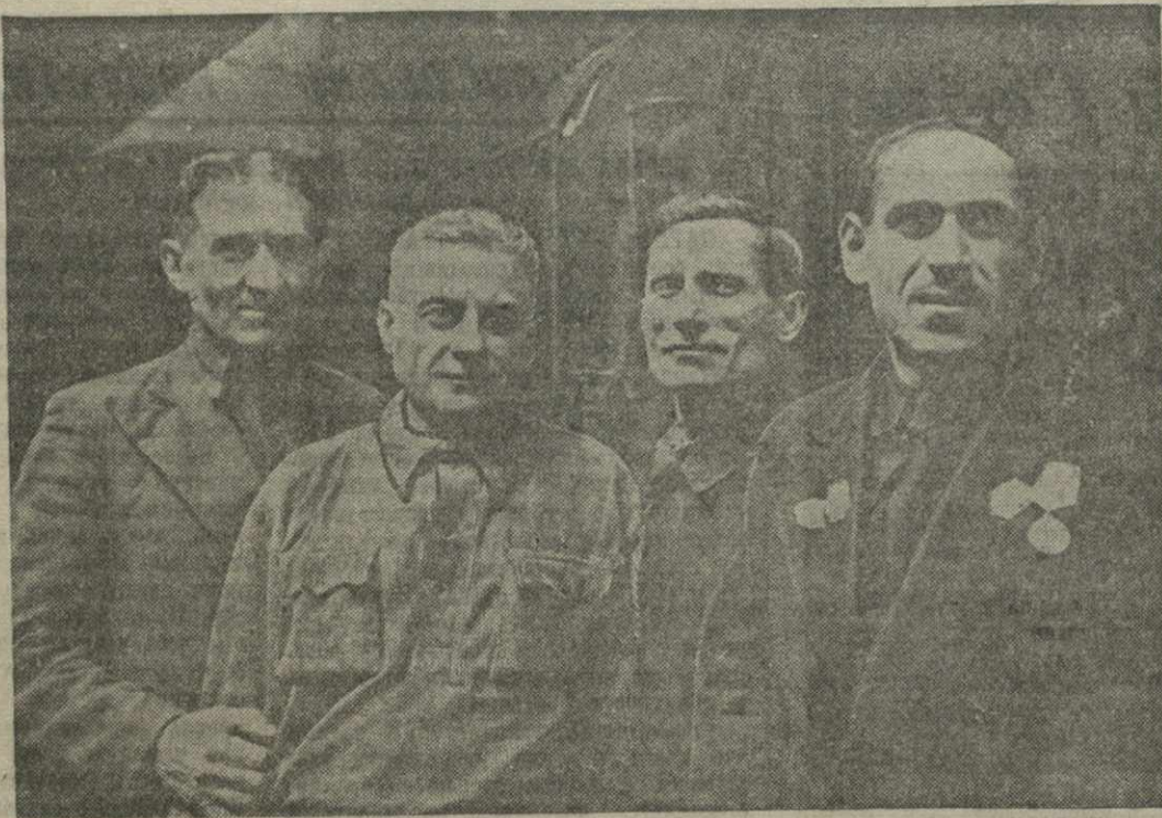
Имена этих стахановцев широко известны. Это — подлинники мастера социалистического труда, кадровые рабочие Тбилисского паровозо-вагоноремонтного завода имени Сталина. Через их руки проходит важнейшая на заводе работа по ремонту паровозов для нашего социалистического транспорта...