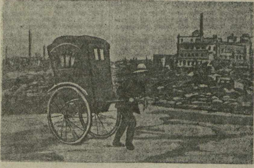
В Японии после войны, «Машина» в одну человеческую силу — наиболее употребительный вид городского транспорта в современном Токио.

Осеню прошлого года в иностранных газетах сообщалось: Японский император будет предан суду Международного трибунала.