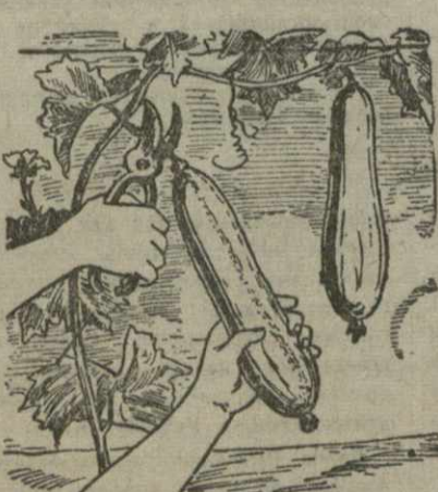
Сбор плодов люфы.

Среди разводимых в Грузии технических культур перед войной широкое развитие получила люфа.