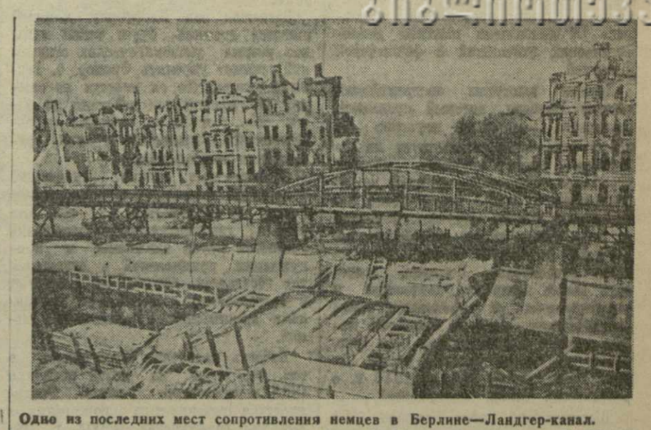
Одно из последних мест сопротивления немцев в Берлине — Ландгер-канал.