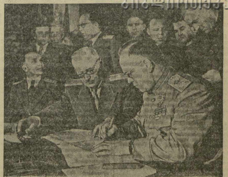
На снимке: момент подписания Декларации о поражении Германии. Подписывает по уполномочию Правительства Союза Советских Социалистических Республик Главнокомандующий советскими оккупационными войсками в Германии Маршал Советского Союза Г. К. Жуков. Слева — Заместитель Народного Комиссара Иностранных Дел СССР А. Я. Вышинский.