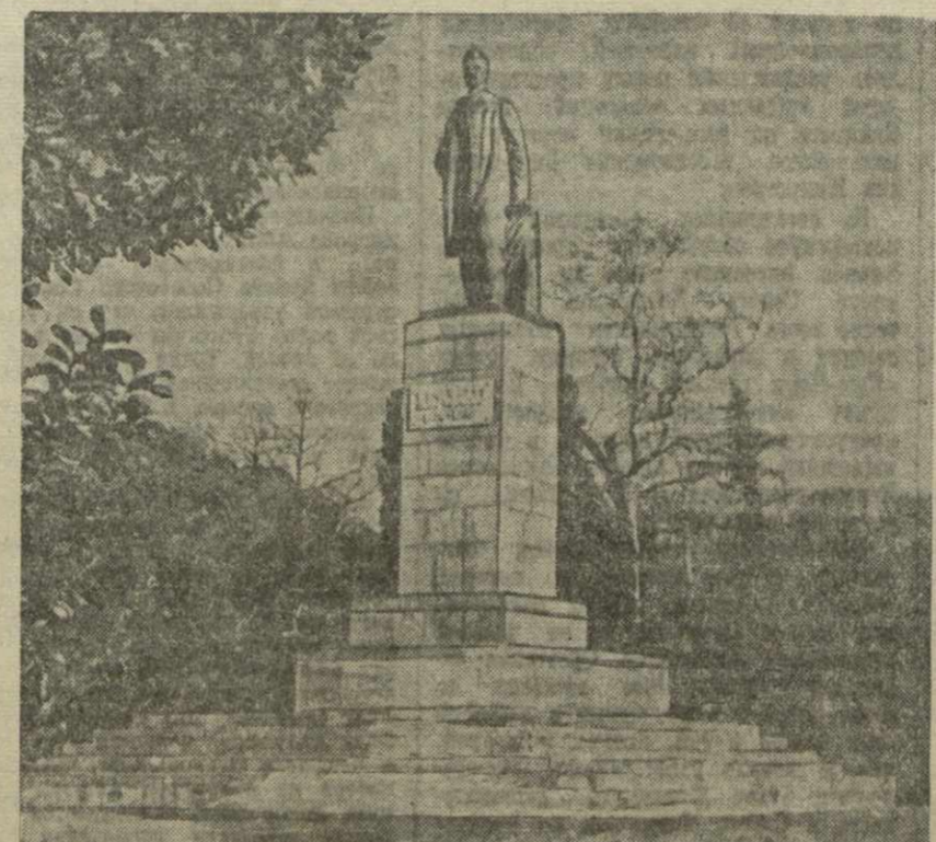
Кутаиси. Памятник А. Цулукидзе.

По телефону и телеграфу от наших корреспондентов