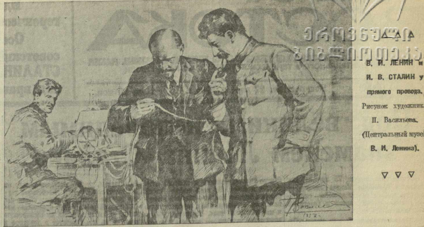
И. В. СТАЛИН у прямого провода. Рисунок художника П. Васильева. (Центральный музей В. И. Ленина).

Близок час полного освобождения Европы от гитлеризма. Как ни сопротивляется смертельно раненый фашистский зверь, он обречён и будет добит. Советский народ до конца выполнит свою великую освободительную миссию. Вместе со своими союзниками он нанесет последний смертельный удар в сердце гитлеровской Германии.