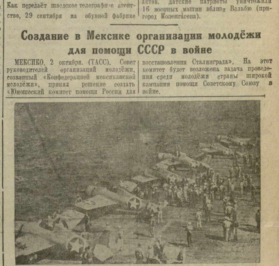
На снимке: на борту американского авианосца, направляющегося в Африку, летчики-истребители перед взлетом производят проверку исправности пулеметного вооружения самолетов.

На железнодорожной линии Хоренсе — Фредерия произведено 15 диверсионных актов. Датские патриоты уничтожили 16 военных машин вблизи Вальбю (пригород Копенгагена).