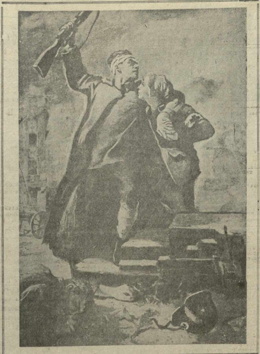
ИЗ РАБОТ ГРУЗИНСКИХ ХУДОЖНИКОВ «Призыв раненого». Худ. У. Джапаридзе.

СУХУМИ. (Наш корр.). Некоторые колхозы Гуарьшского района закладывают питомники эвкалипта, который будет широко применяться для создания ветрозащитных полос цитрусовых насаждений. Большой питомник организуется в Колорском колхозе «Усу-Иль». Эвкалиптовые саженцы здесь уже высеяны на площади в 66 квадратных метров.