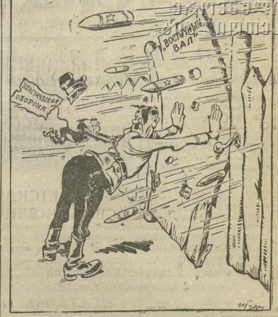
Укрыться за «восточным валом» Побитый Гитлер возмечтал, Но ураганом небывалым Разносит в клочья этот вал.

Рисует И. Гурро. Стихи ГЕОРГИЯ КРЕМЛЕНА.